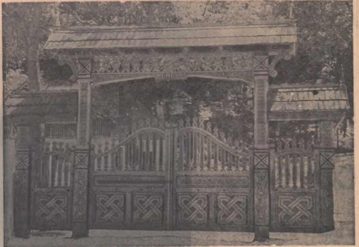
Poarta școlii generale de 8 ani — comuna Mușetești, raionul Curtea de Argeș