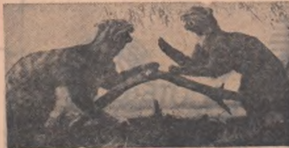
Pisici sălbatice de grinduri. (Dioramă din Muzeul Deltei din Tulcea)

...orice străin care trăiește mai mult de un an în insula Martinica crește, indiferent de vîrstă, cu cîțiva centimetri? Acest fenomen se datorește radiațiilor care asupra localnicilor nu au însă nici o influență.