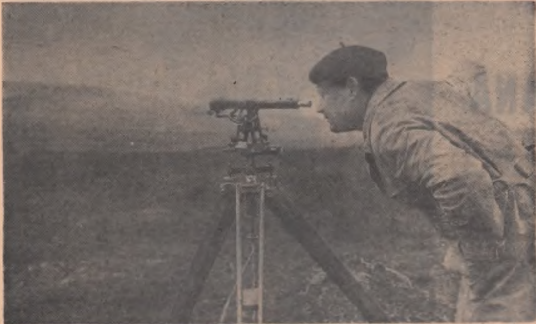
C.A.P. Șaringa, raionul Mizil. Se pichează rindurile pentru vița de vie

O atenție deosebită a fost acordată chimizării agriculturii care, alături de mecanizarea lucrărilor, constituie unul din factorii esențiali pentru obținerea unor producții medii ridicate la unitatea de suprafață. În urma extinderii pe care a luat-o ramura industriei producătoare de îngrășăminte chimice în anul 1966 agricultura a primit circa 1245 000 tone îngrășămint, ceea ce reprezintă o creștere de peste 55 de ori mai mult față de anul 1950. Cunoscut fiind efectul economic al folosirii îngrășămintelor chimice în creșterea producției în anul 1970 se va aplica o cantitate de 3,3 ori mai mare decît în anul 1965 ceea ce va însemna un spor însemnat de producție.