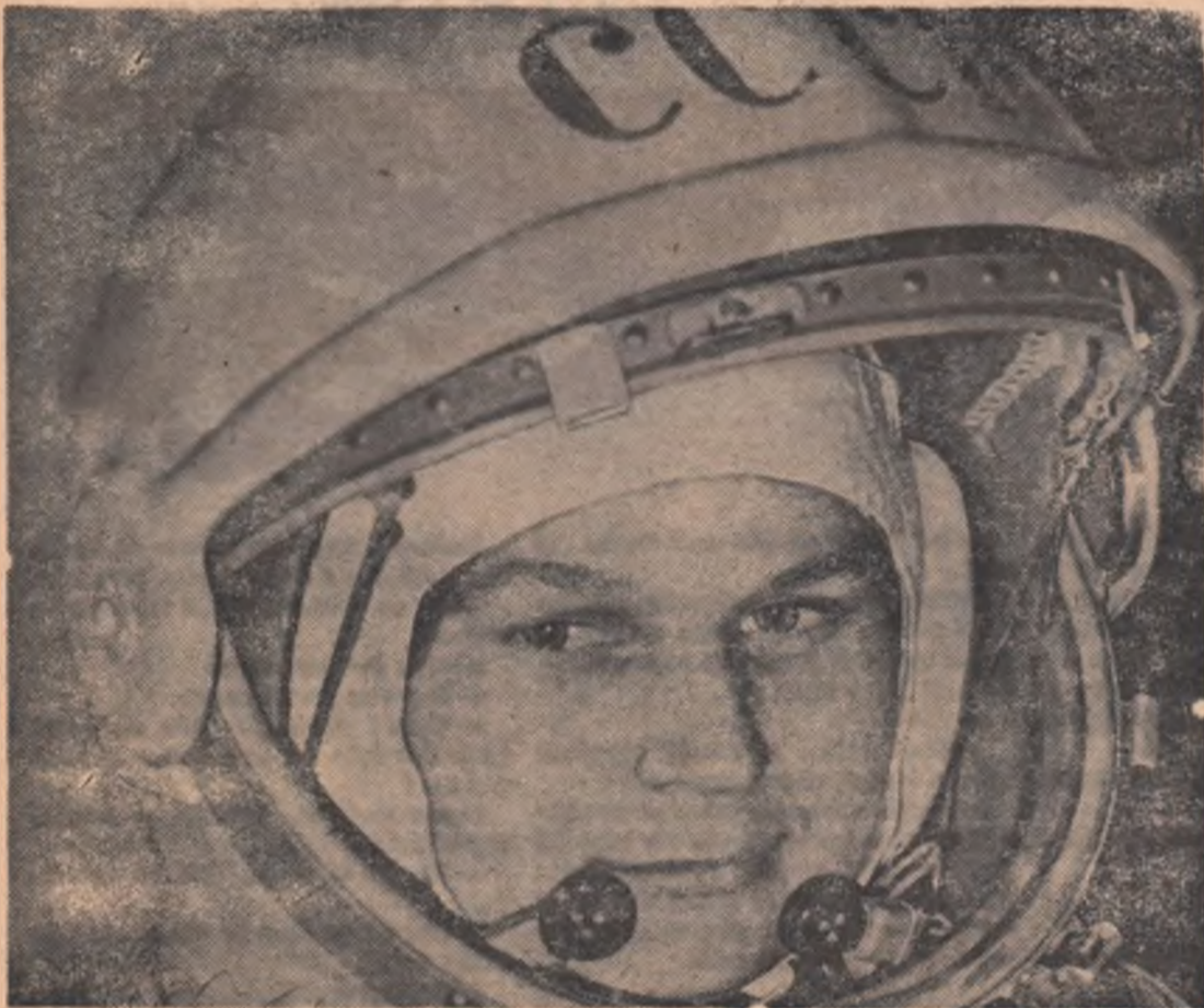
Valentina Tereșkova — prima femeie cosmonaut din lume

Să ne oprim însă aici, nu înainte de a ne exprima convingerea fermă a succesului acestor întreprinderi, destinate progresului continuu al omnirii șiuceririi pașnice a infinității Cosmosului.