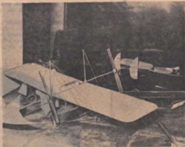
Macheta avionului Vlaicu II