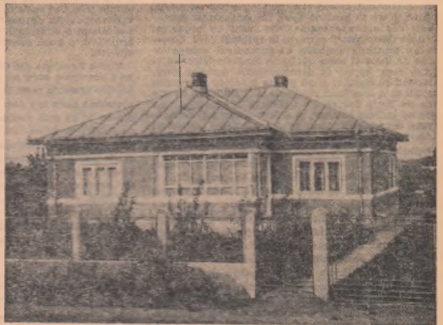
Casă nouă din comuna Secuieni, regiunea Bacău