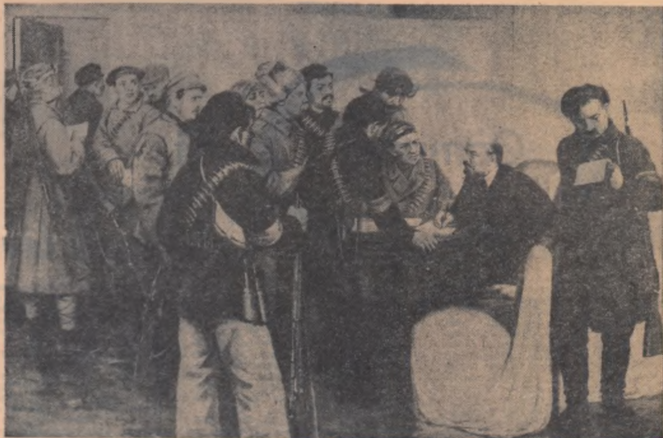
V. I. Lenin la Smolnii in octombrie 1917

SEMICENTENARUL MARII REVOLUȚII SOCIALISTE DIN OCTOMBRIE