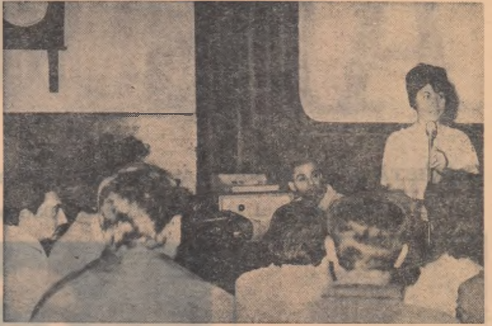
O seară literară cinematografică la căminul cultural din comuna Răcăciuni, regiunea Bacău