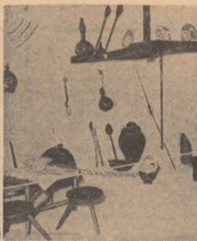
Muzeul Golești, secția etnografică: obiecte din raionul Rm. Vilcea