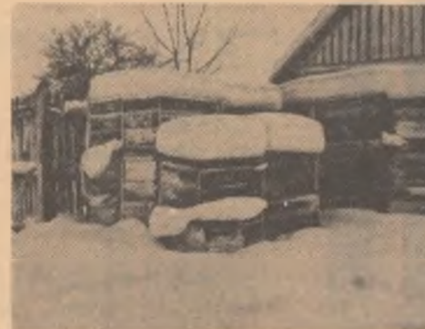
Atențiune apicultori! S-a descoperit cel mai bun sistem de conservare a stupilor: sub omătul mare în curte.