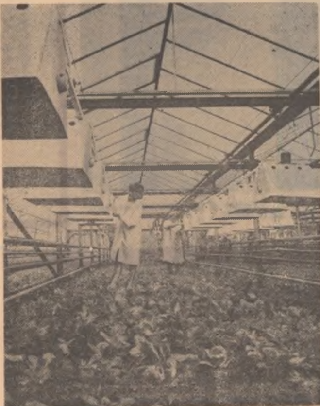
Controlul climatului în seră