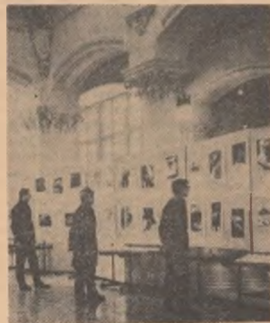
Aspect de la expoziția interregională de fotografii deschisă de curind în Palatul culturii din Iași