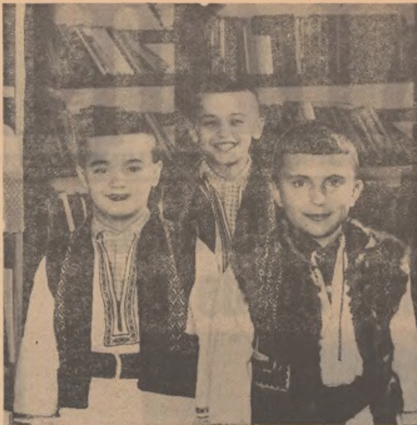
Alături de cititorii mai vîrstnici, acești școlari sînt oaspeți frecvenți ai bibliotecii din comuna bucovineană Vama

(După o corespondență de NICULAI TRISTU)