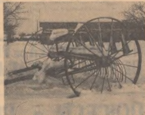
Aici se odihnește o greblă mecanică precum și grija față de uneltele agricole, a conducerii C.A.P.