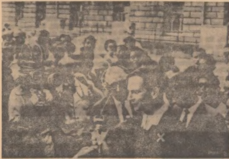
Doctorul Chris Barnard (x) — primul chirurg din lume — care a făcut o transplantare de inimă de la un om la altul, în fața spitalului Groote Schuur, după terminarea operației de transplantare a inimii pacientului Philip Blaiberg