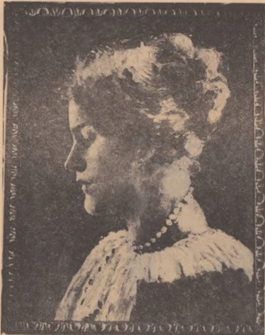
Portret — Șt. LUCHIAN