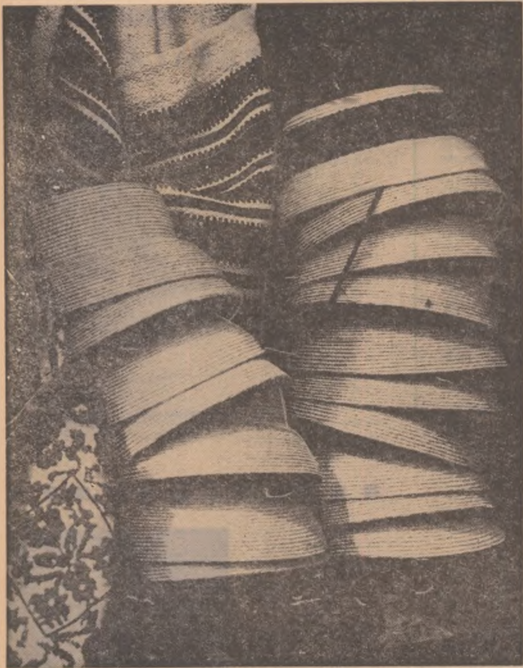
Oricine ar vre purta Clopu, pana și straița Da' oșanu nu le-o da.