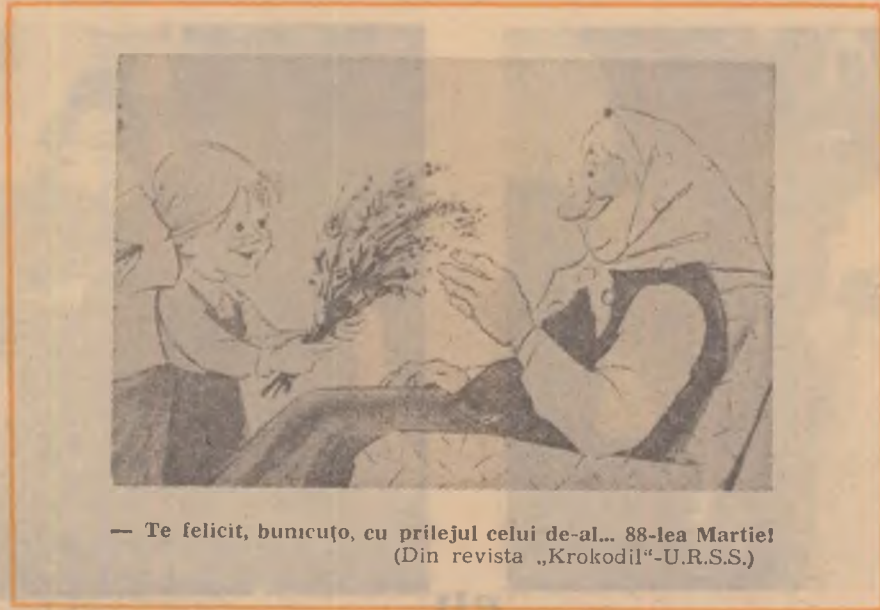
— Te felicit, bunucufo, cu prilejul celui de-al... 88-lea Martie! (Din revista „Krokodil“-U.R.S.S.)