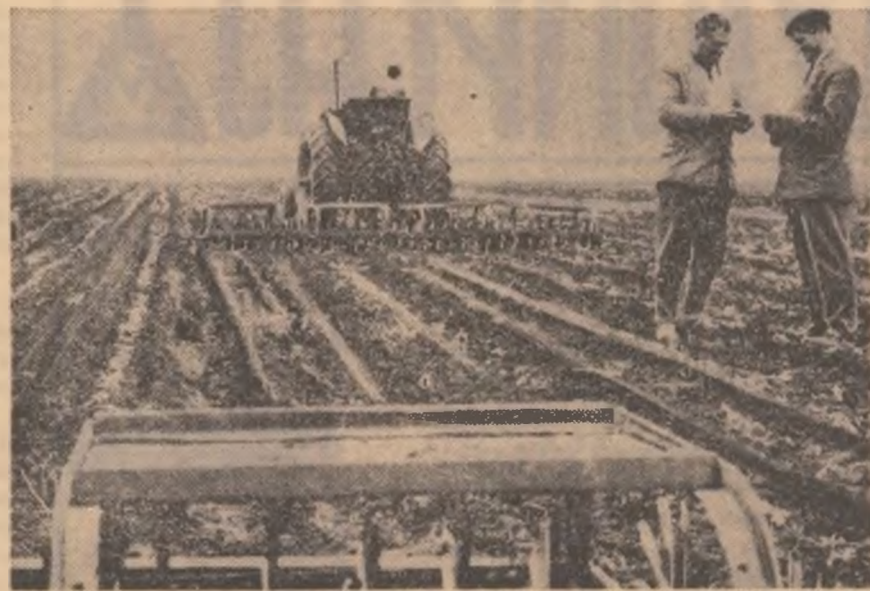
C.A.P. Feculești, județul Teleorman: prima prașilă la floarea soarelui