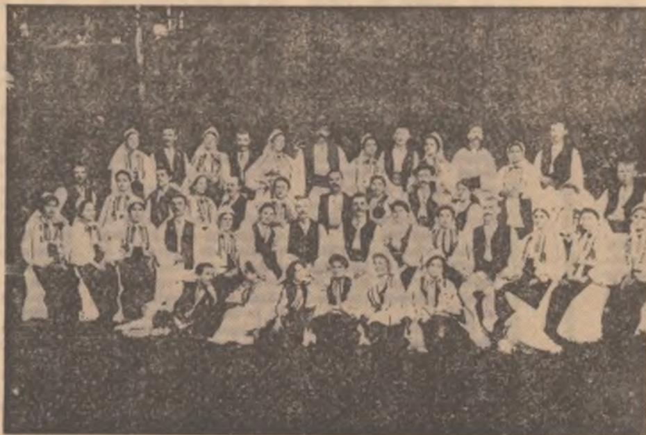
Fotografia de față a fost făcută în anul 1900 și reprezintă corul din Săliște care acum o sută de ani, cînd a luat ființă, se intitula „Reuniunea română de cîntări Săliște”, fiind cea mai veche asociație corală din Transilvania după cea a lui Ion Vidu din Banat. În acești o sută de ani corul din Săliște a avut o activitate bogată pe tărîmul manifestărilor cultural-artistice. Această activitate l-a adus o faimă binemeritată, corul din Săliște contribuind, în decursul existenței sale, la popularizarea și răspîndirea frumuseții cîntecului și jocului românesc.