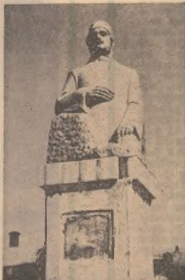
De luni de zile, această statuie din Rm. Vilcea este ținută de edili orașului și de organele culturale, fără nici o inscripție. Cine este marele nedreptățit de pe soclu? Nimeni altul decît Anton Pann, care a trăit și a lucrat multă vreme în Rm. Vilcea, spre gloria acestui oraș. De ce atîta nerecunoștință față de un înaintaș ilustru?