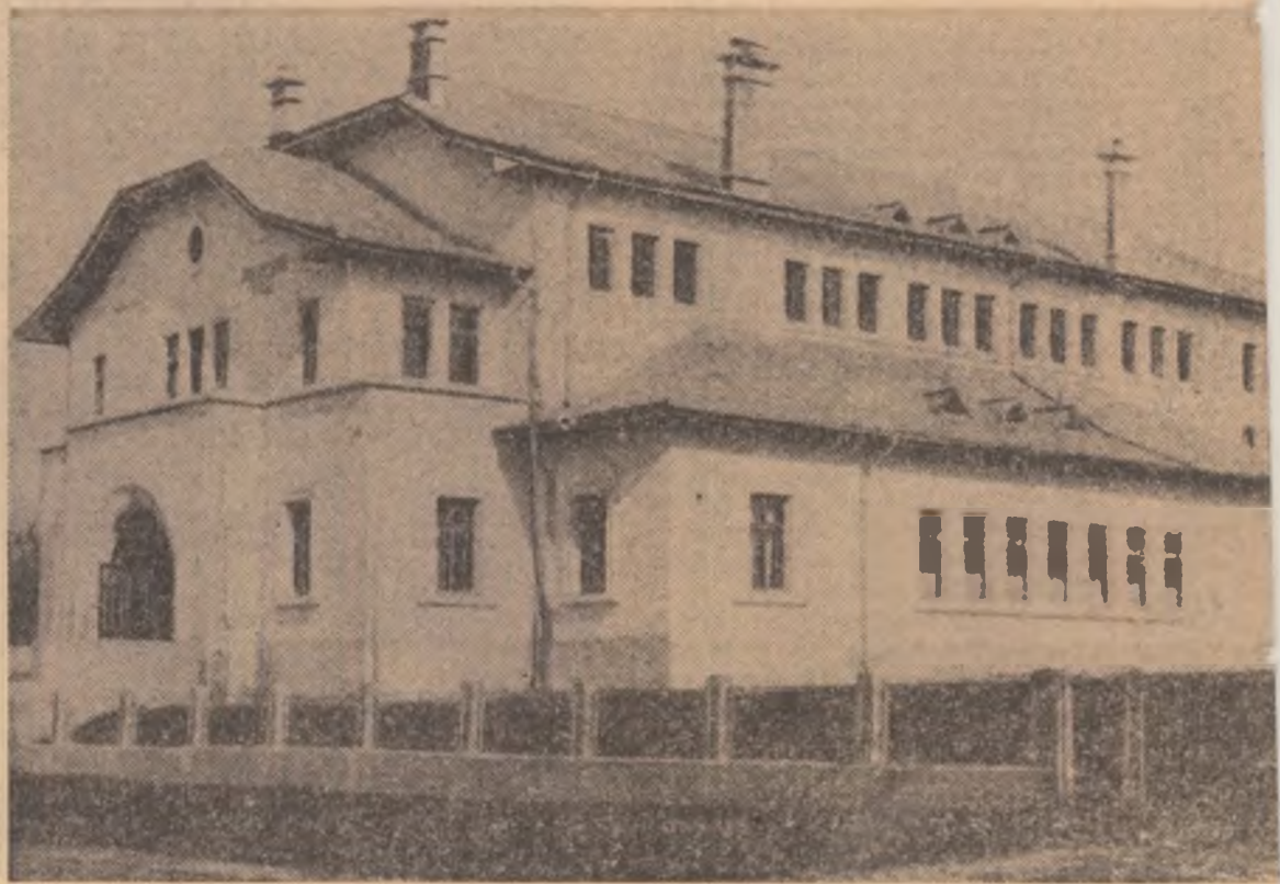
Căminul cultural din Dolhești Mari