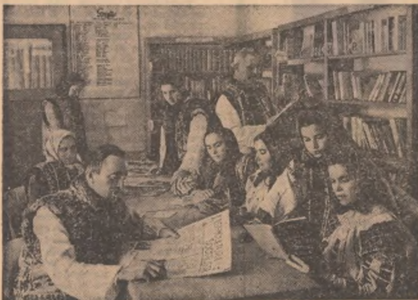
La bibliotecă, într-un sat sucevean.