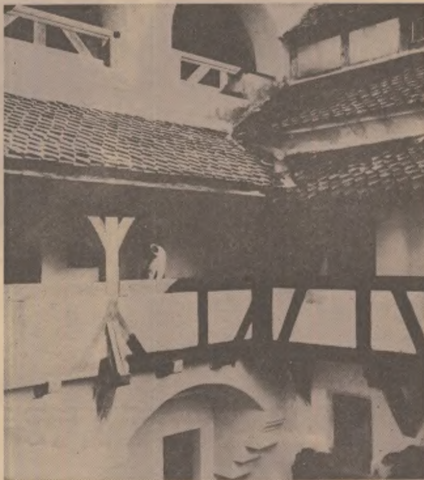
Coridorul străjii ce se află în curtea interioară a castelului de la Bran