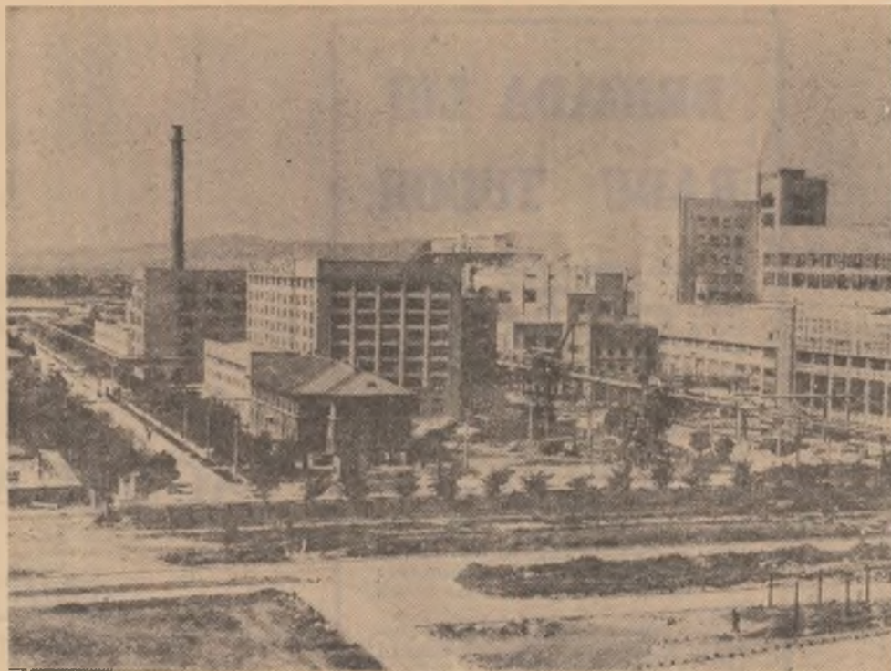
Vedere generală a

La Lotru se interferează prin amestecul de oameni veniți de pretutindeni toate regiunile țării. Dar mai poate fi vorba și de o zonă a întreprinderilor folclorice. În cuprinsul