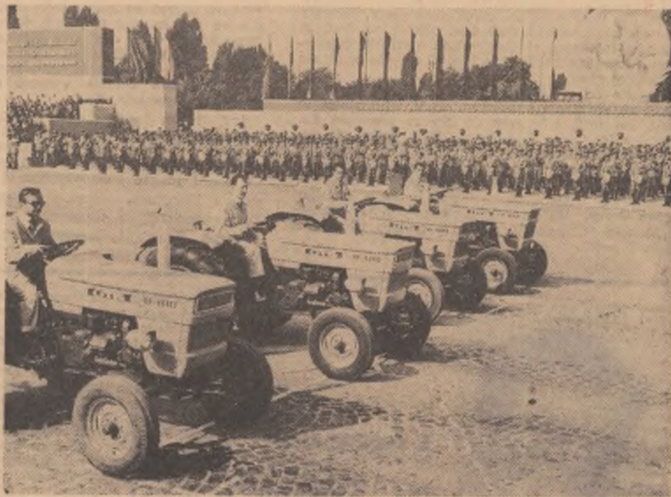
Alături de numeroasele utilaje petroliere, mașinile și alte produse ale industriei noastre socialiste bine apreciate în țară și peste hotare, noile tractoare „UNIVERSAL 400” reprezintă o victorie de seamă a constructorilor de mașini din țara noastră