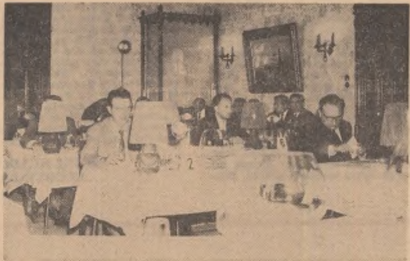
Primul concurs internațional de vinuri organizat în țara noastră s-a încheiat recent la Palatul Buftea. Această prestigioasă manifestare a fost de fapt o încununare a numeroaselor succese repurtate de România la concursurile internaționale, o recunoaștere a succeselor deosebite obținute de viticultorii noștri în ultimii ani. La cele 29 concursuri de vinuri organizate peste hotare în ultimul deceniu, România a câștigat peste 500 medallii de aur și

aproape 1 000 medallii de argint și bronz. Este un succes remarcabil care explică ecoul favorabil produs pe toate continentele la invitația făcută de Consiliul Superior al Agriculturii, pentru participarea la prima ediția a Concursului internațional de vinuri organizat în România.