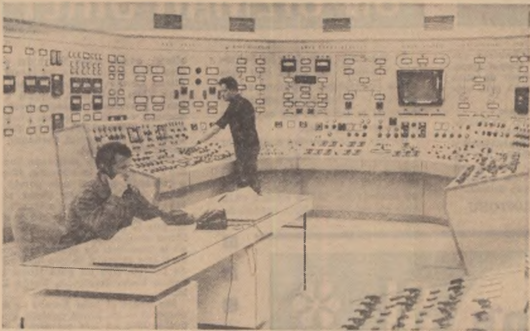
In sala de comandă a termocentralei d.n. Luduș.