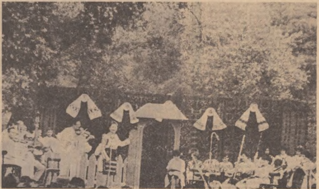
Spectacolul „La șezătoare” prezentat de ansamblul folcloric din Huedin în comuna Bulz județul Bihor.