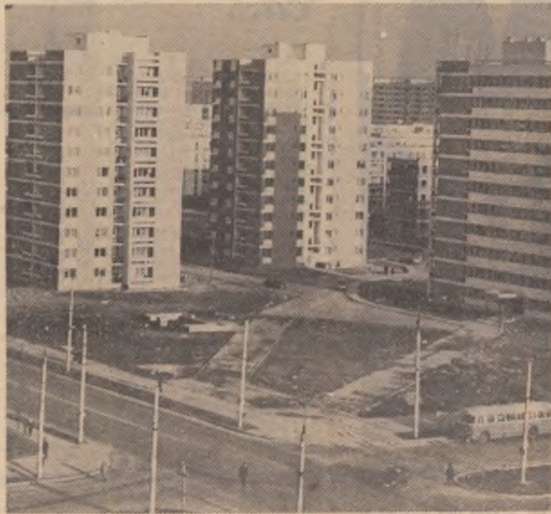
Să ne trăiești, nou București!