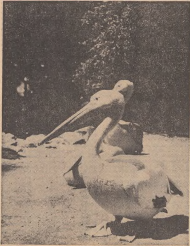
Idilă în Deltă