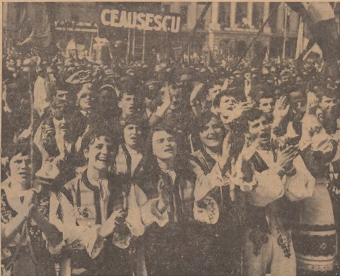
Ovații nesfîrșite pentru conducătorii de partid și de stat