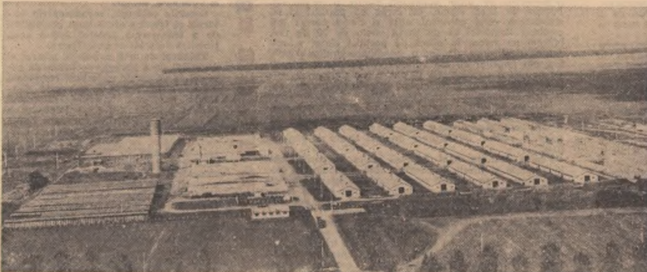
Complex zootehnic la I.A.S. Giurgiu

Iar redacția propune ca vinovații, adică specialiștii de la Buhuși care au executat lucrarea, să fie trași la răspundere.