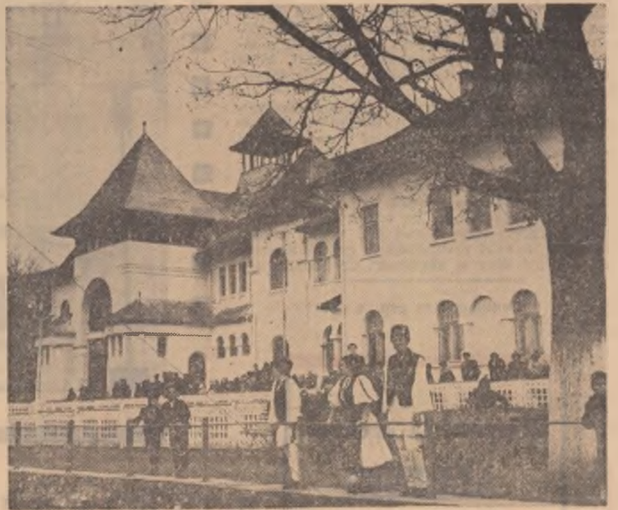
Căminul cultural din Rășinari, județul Sibiu

Așteptăm răspuns la ghicitoarea noastră de la comitetul pentru cultură și artă din Titu.