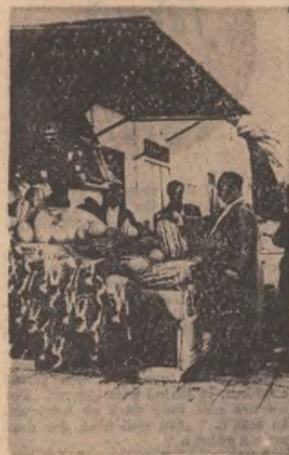
Se vind pepeni gustoși în cartierul La Goulette din Tunis