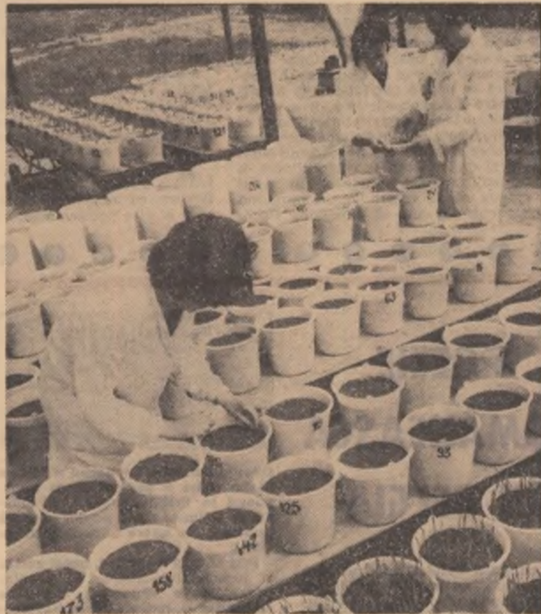
Observații asupra dezvoltării plantelor la Stațiunea experimentală agricolă Livada, județul Satu Mare

Lucrarea scrisă atractiv se va bucura de o largă audiență din partea publicului cititor.