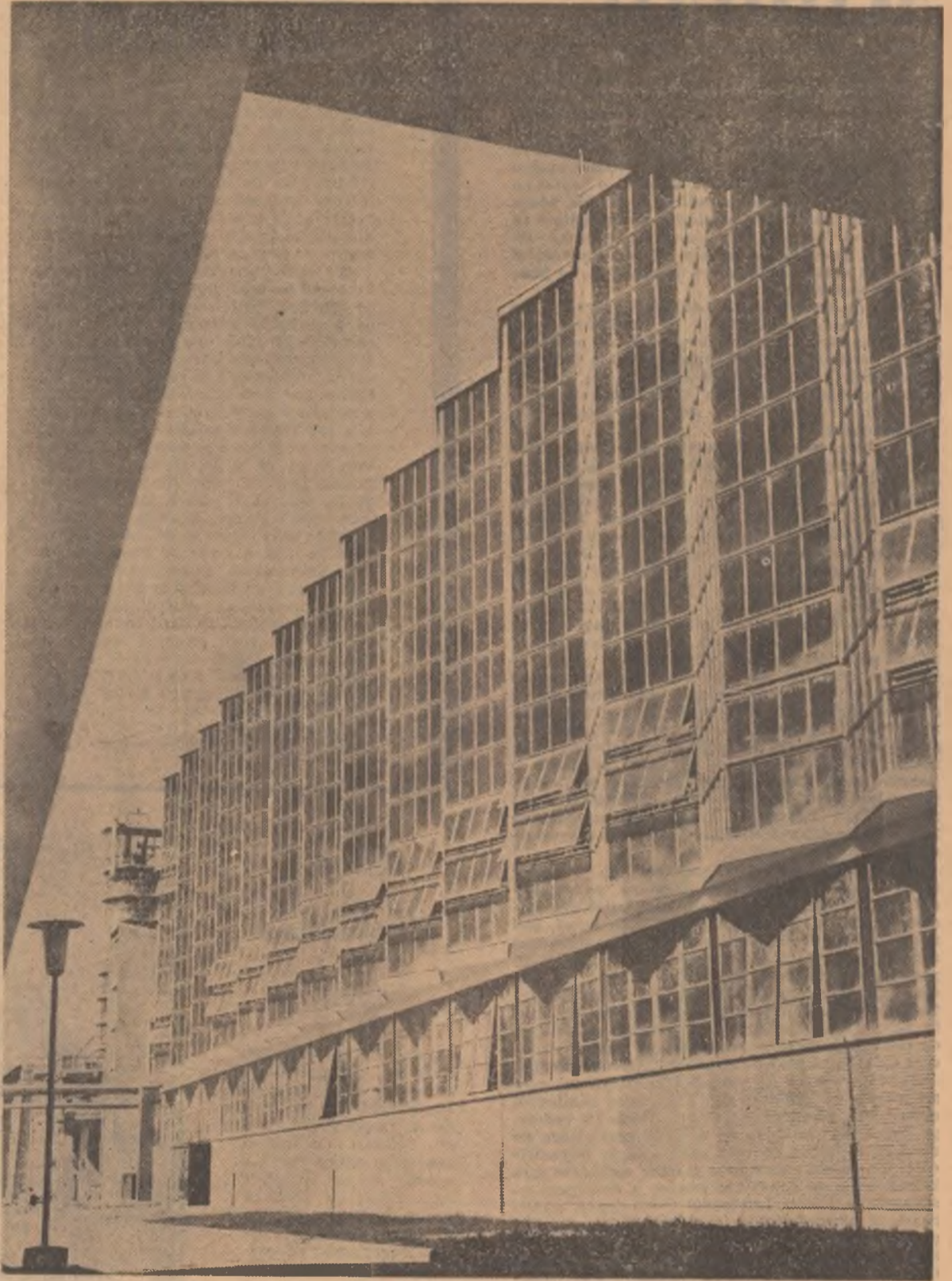
Fabrica de zahăr din Buzău