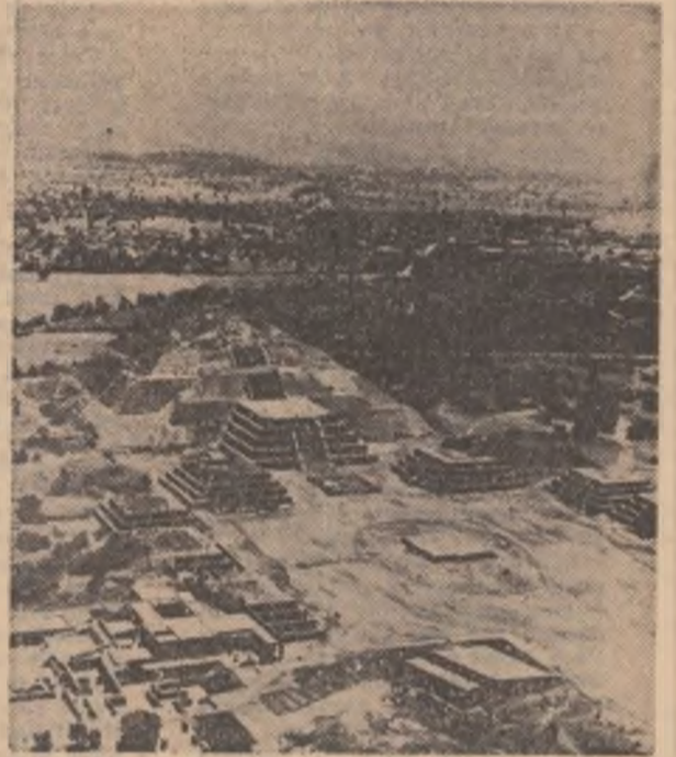
Piramidele de la Teotihuacan — Mexic