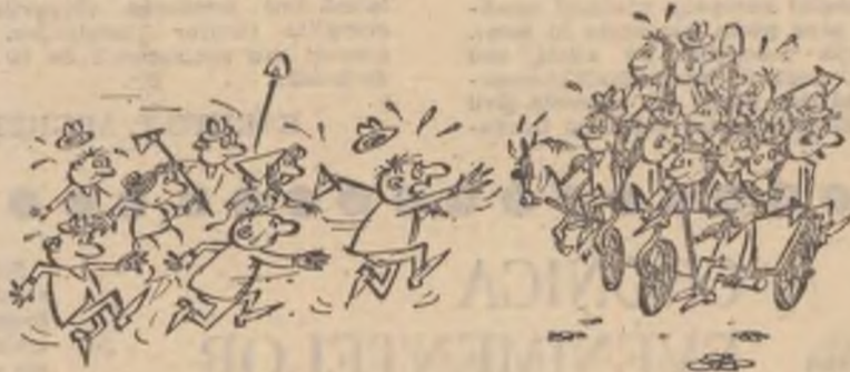
— Fraților, luați-ne și pe noi, că iar ne-a lăsat șoferul de căruță !!!

Șoferul C.A.P.-ului din comuna Mislea, nu aduce oamenii de la locul de muncă, fiind preocupat de transporturi personale.