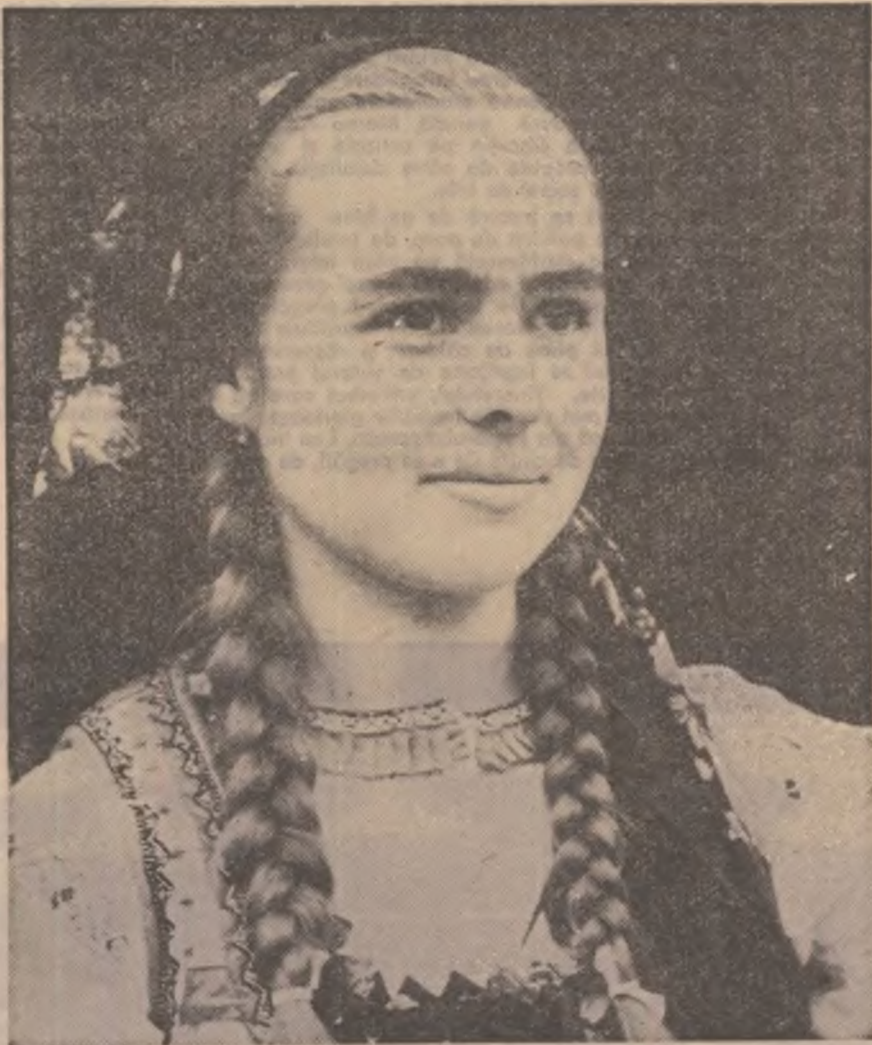
Fată din Rupea-Brașov