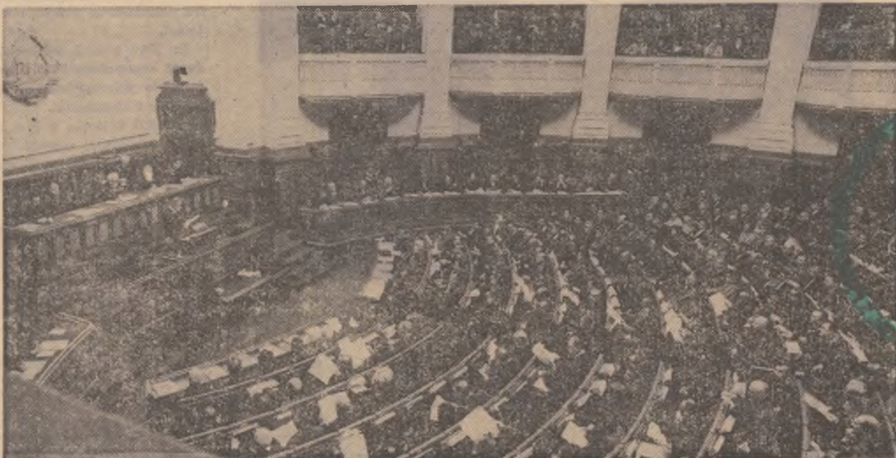
Aspect de la una din sesiunile sesiunii Marii Adunări Naționale