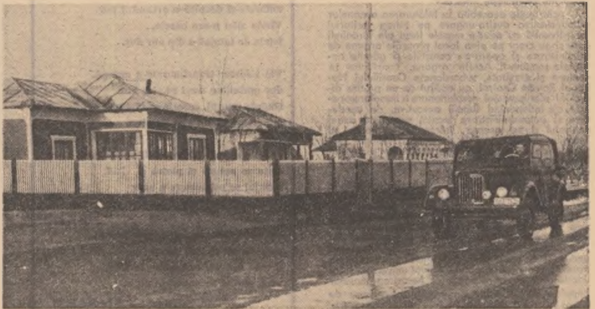
Vedere din Stoicănești-Olt

președinte al Consiliului popular, comuna Albești-Paleolog Județul Prahova