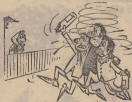
Trei doamne și toți trei...

Desen dedicat celor trei frați Istrate din comuna Aluniș.