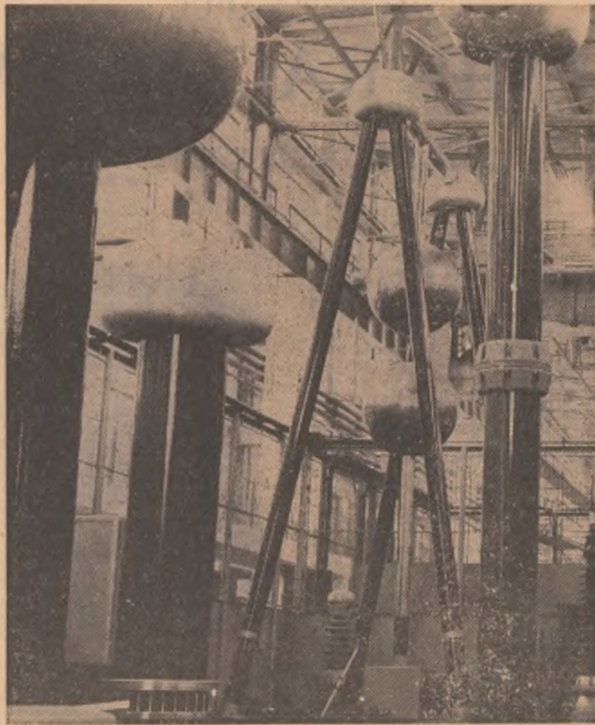
Fabrica de aparataj electric de la uzinele „Electroputere” Craiova