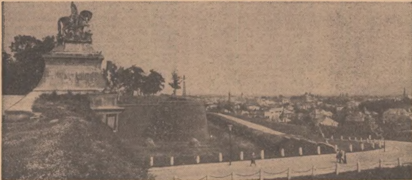
Alba-Iulia — vedere generală