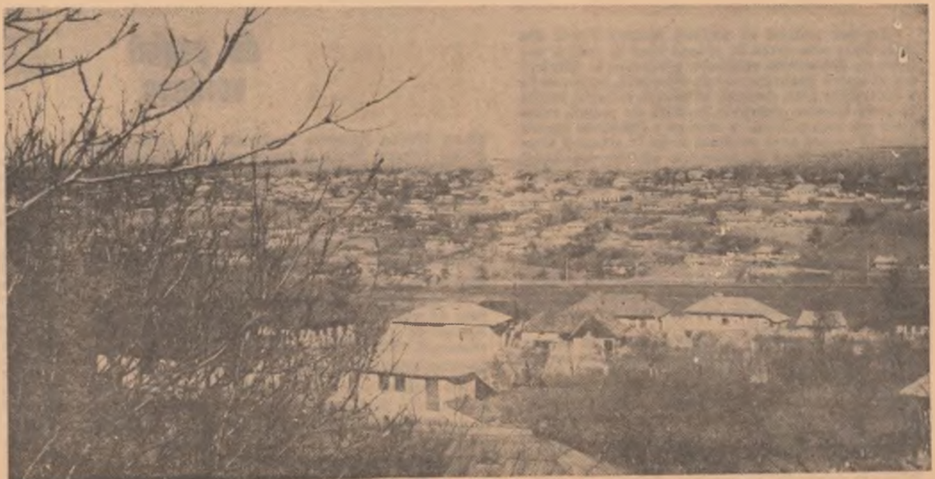
Comuna Roma — Botoșani

Măsurile și hotărîrile recentei plenary a C.C. al P.C.R. se bucură de adeziunea întregului popor, ele se înscriu în ansamblul măsurilor luate, în ultimii ani, de partidul nostru pentru perfecționarea relațiilor socialiste, a formelor și metodelor de organizare și conducere, pentru lărgirea democrației socialiste, corespunzător etapei actuale de dezvoltare a societății românești.