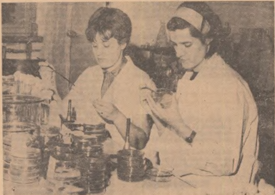
În unul din laboratoarele L.C.C.P.T. Fundulea se fac cercetări pe culturi microbiene din sol

Aparatul este montat pe conductă din imediata apropiere a robinetului principal sau a contorului de apă. Dacă din neatenție, robinetul este lăsat deschis cînd se oprește apa, aparatul îi oprește automat debitul pentru cazul că ar începe să curgă din nou.