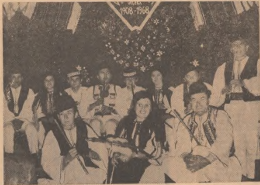
Pe scena căminului cultural