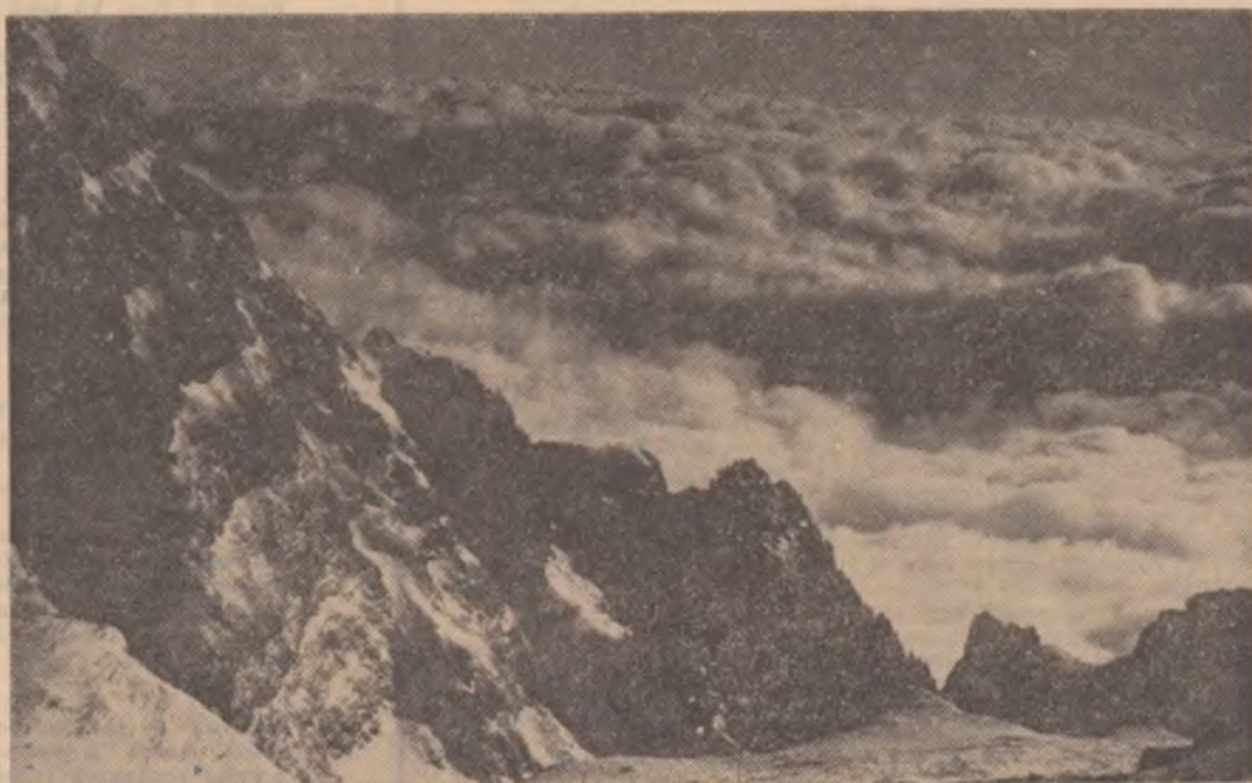
„Salutări din Bucegi!”