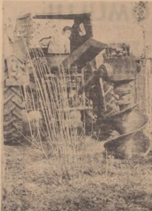
Mașină pentru executarea gropilor în vederea plantării de pomi

În vederea stimulării producției unor produse de stat, se prevede ca impozitul stabilit pe baza veniturilor efective să fie redus cu 25 la sută pentru acele venituri care sînt realizate din livrarea de produse către organizațiile socialiste, pe bază de contracte încheiate cu acestea.