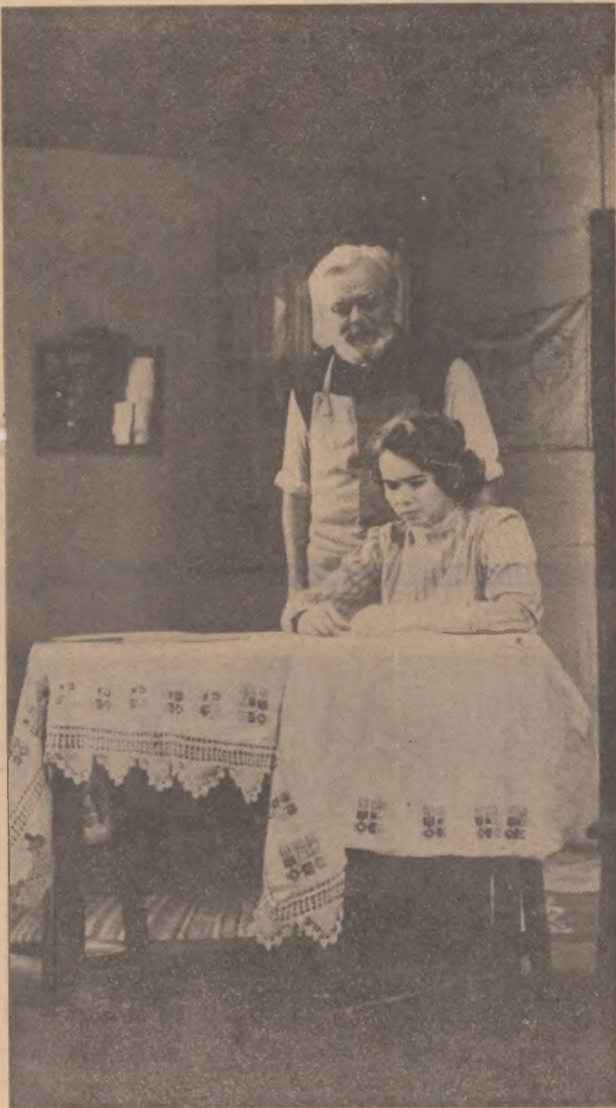
Scenă din piesa „Domnișoara Nastasia” prezentată de Teatrul popular din Plopeni-Prahova, la finala celui de al V-lea Festival de teatru „I. L. Caragiale”