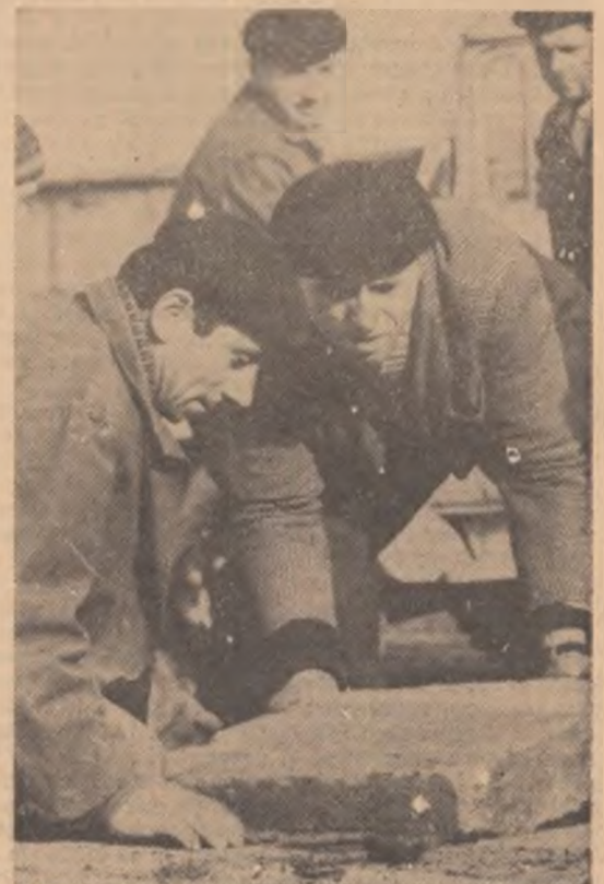
La muncă patriotică în comuna Voluntari-Ilova