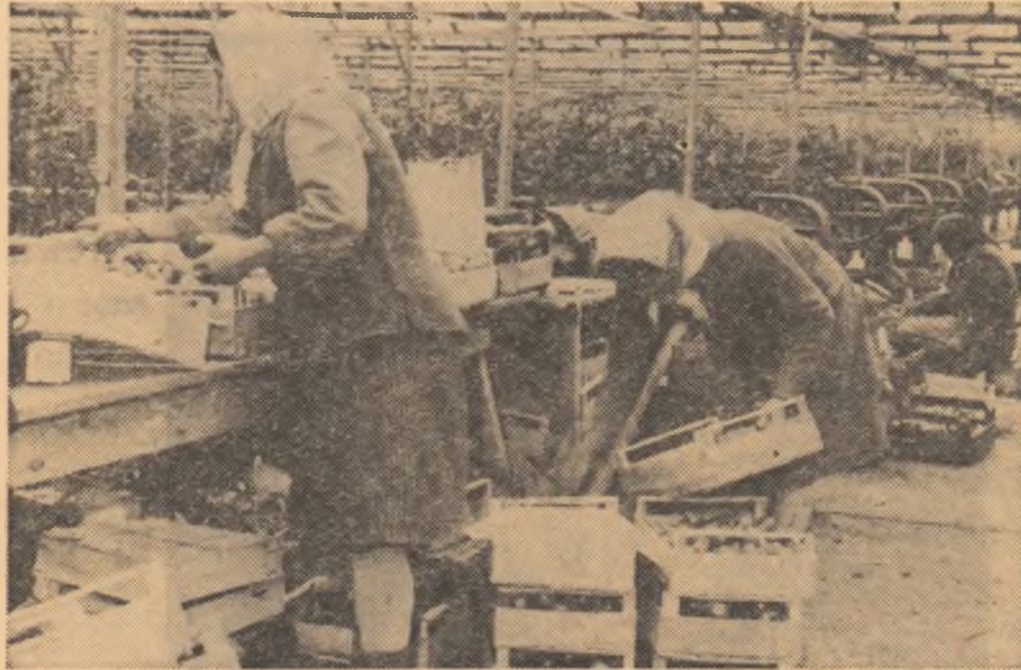
La C.A.P. Otopeni în ciuda gerului o nouă recoltă de roșii