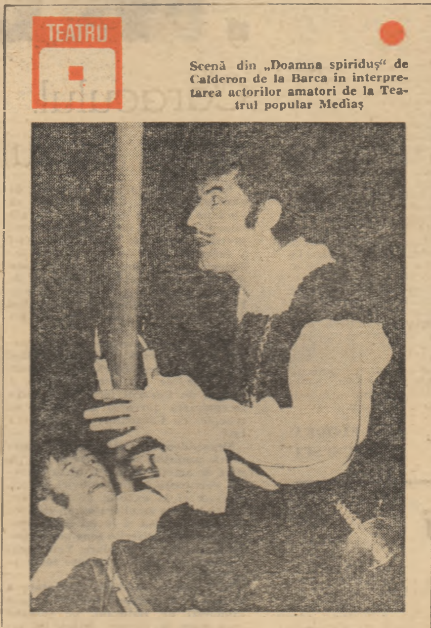
Scenă din „Doamna spiriduș” de Calderon de la Barca în interpretarea actorilor amatori de la Teatrul popular Mediaș

*) Colecția „Teatru” a Casei centrale a creației populare.