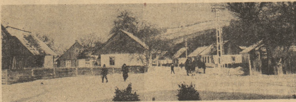
Ilustrată din comuna Putna