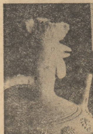
Fragment de ulcior