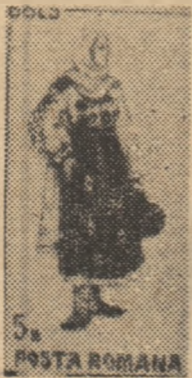
— 5 bani — costum femeiesc din județul Dolj; — 40 bani — costum bărbătesc din județul Dolj;

În cadrul seriei valorile au fost depuse astfel: