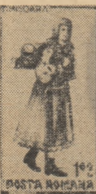
— 1,60 lei — costum femeiesc din județul Timiș; — 2,40 lei — costum bărbătesc din județul Timiș.