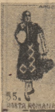
— 55 bani — costum femeiesc din județul Argeș; — 1 leu — costum bărbătesc din județul Argeș;