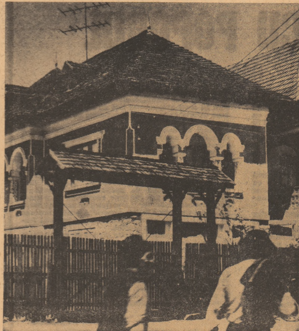
Casă din Mușătești (Argeș)