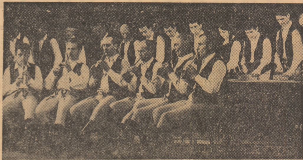
Orchestra de țittere a căminului cultural din Ciumani