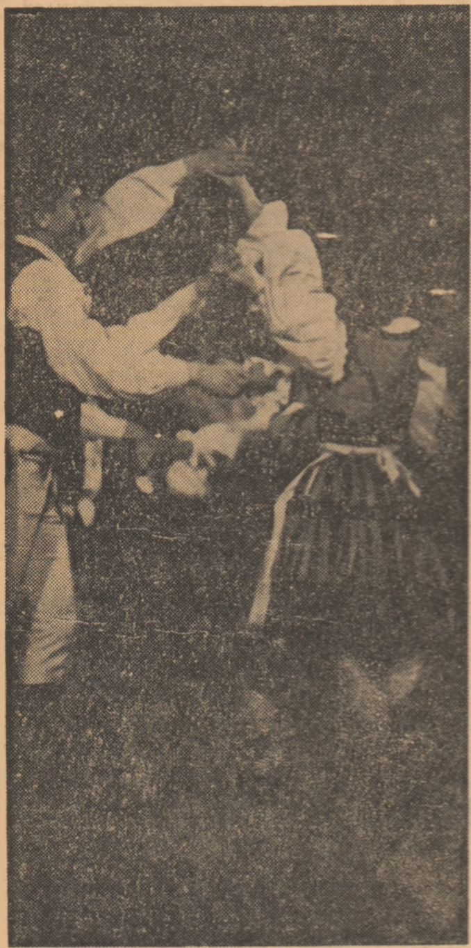
Dansatori de la Uzinele textile „Oltul” din Sf. Gheorghe.