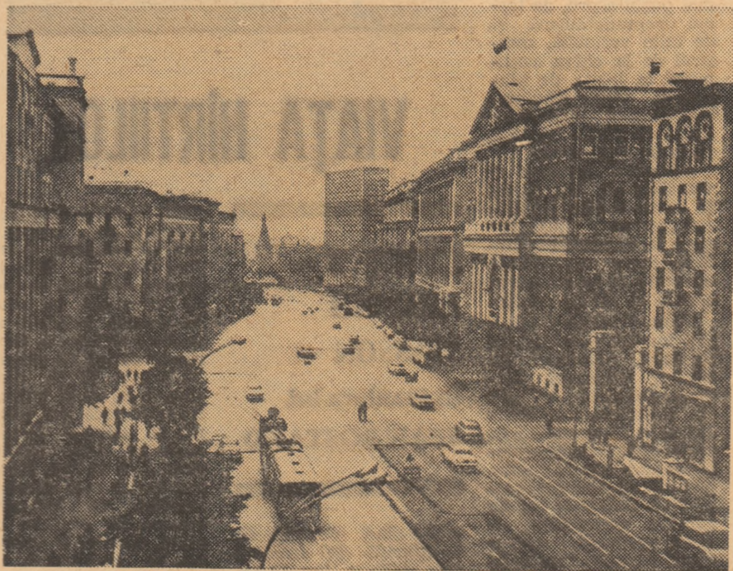
Strada Gorki, una din principalele artere moscovite