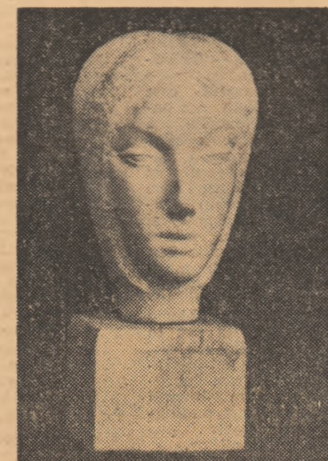
Cap de față