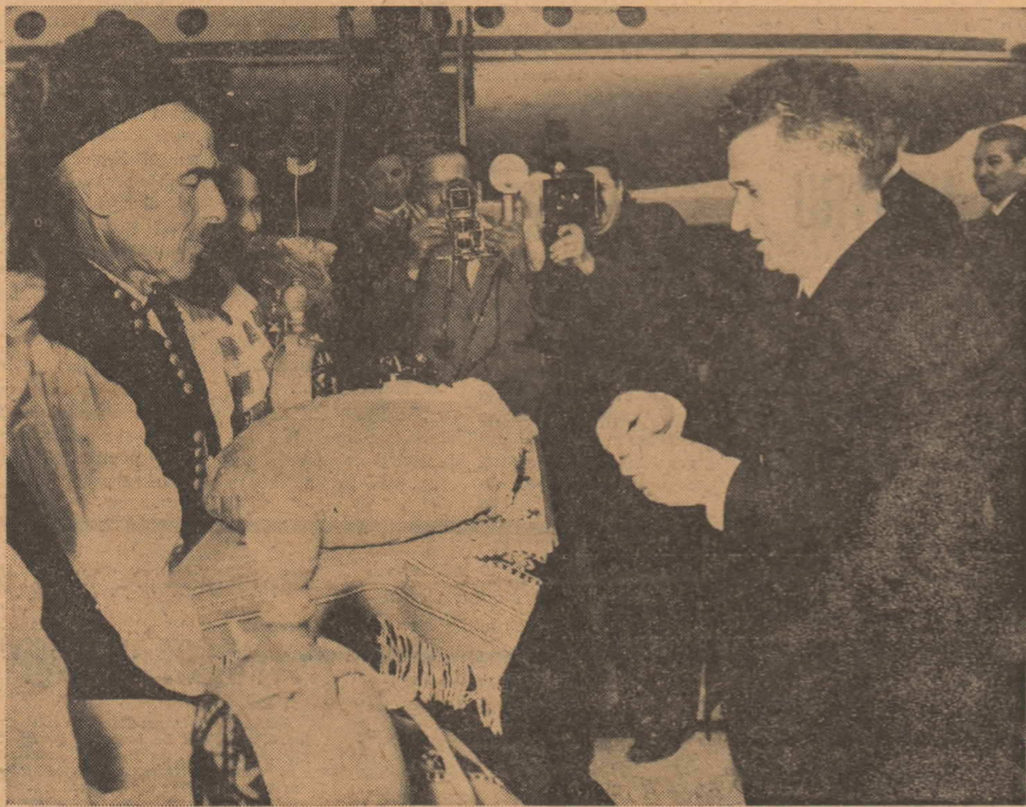
Tovarășul NICOLAE CEAUȘESCU întimpinat cu tradiționala piine și sare

NUMĂRUL 29 (1125) ANUL 72 SERIA II ● JOI 17 iulie 1969 ● 8 pag. 25 de bani