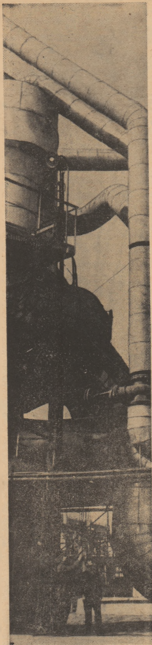
Aspect de la uzina de superfosfați și acid sulfuric din Năvodari.

Construirea unor stații orbitale locuite are o însemnătate deosebită. Referindu-se la această problemă, acad. Serghei Korolev scria încă în 1961: „Stațiile cosmice orbitale sînt