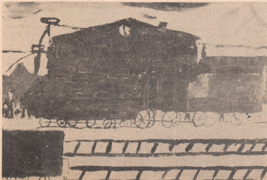
DIN DESENELE COPIILOR