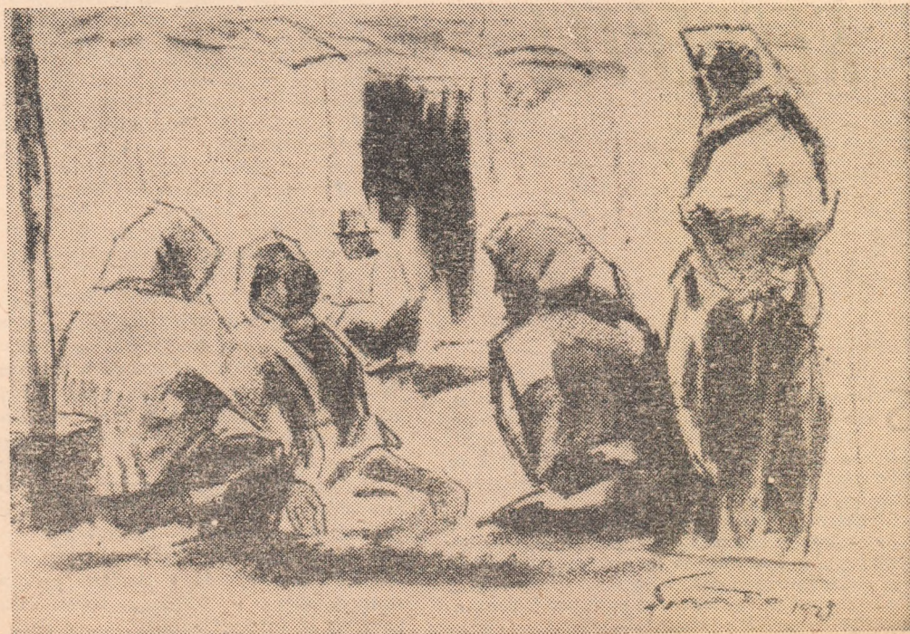
Desen de FRANCISC ȘIRAC