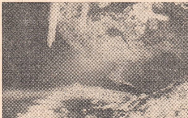
1. Intrare în Ghețarul Scărișoara

Ziua I-a. 15 iulie. Orele 22. Întâlnire la Biroul de informații din Gara de Nord, Urcarea în vagon, în ordinea claselor. După plecarea trenului, o regrupare în compartimente după preferințe. Ora 22,