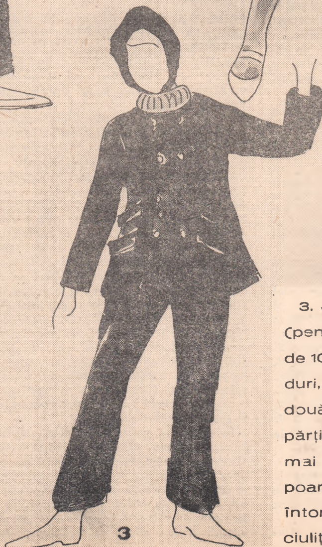
3. Jachetă din postav (pentru fete sau băieți de 10—14 ani), la două rînduri, fără guler, cu cîte două clape suprapuse, în părți. Fiind pentru vreme mai rece, la munte, se poartă cu pulover cu guler întors. Pantaloul și căciulița, d'n același material.