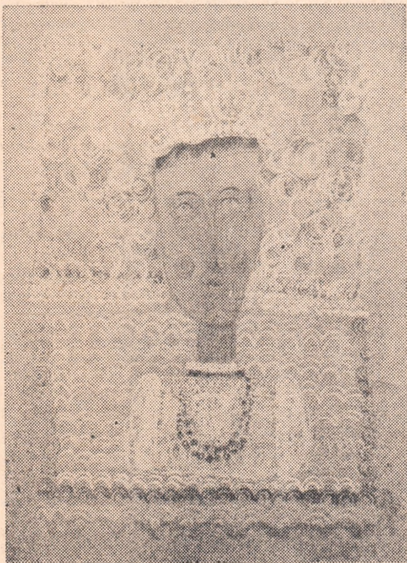
EXPOZIȚIA NAȚIONALĂ DE ARTE PLASTICE A ELEVILOR DIN LICEE, ȘCOLI PROFESIONALE ȘI ȘCOLI DE SPECIALITATE POSTLICEALĂ