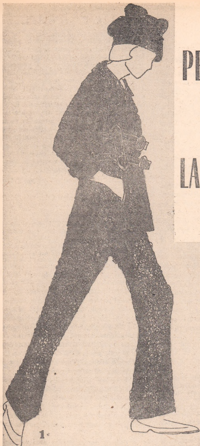
1. Jachetă și pantaloni din stofă groasă, buclé, pentru fete de 16—17 ani. Jacheta se încheie prin două cordoane, trecute prin patru bride late. Bereta, din același material.