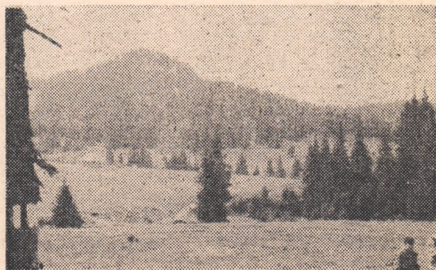
2. Cabana Padiș