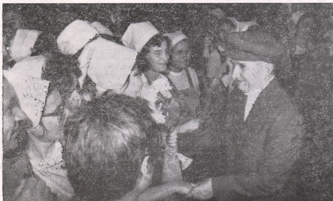
Întîmpinarea înalților oaspeți, după datina străbună