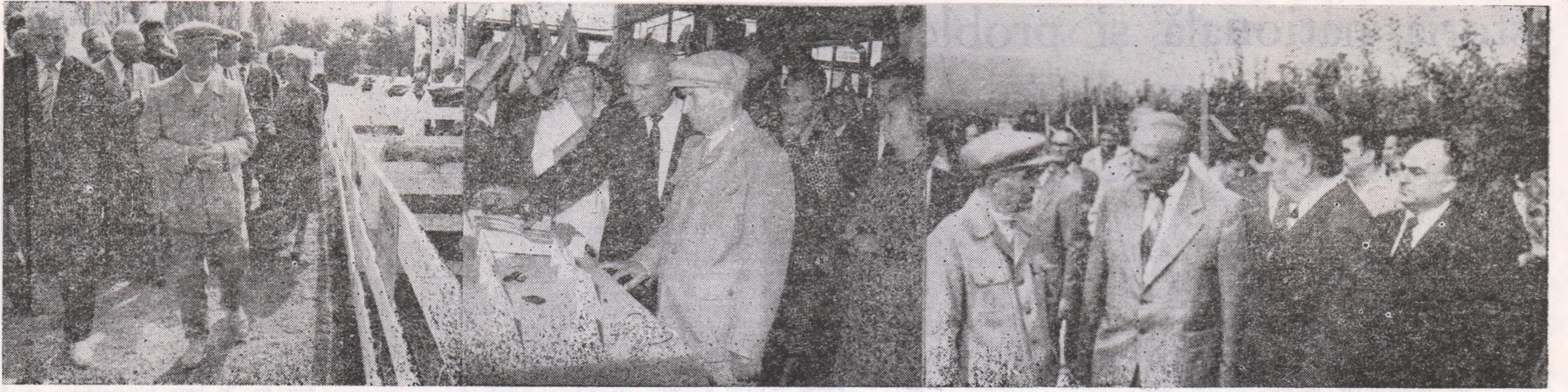
Imagini de la vizita de lucru în municipiul și județul Iași