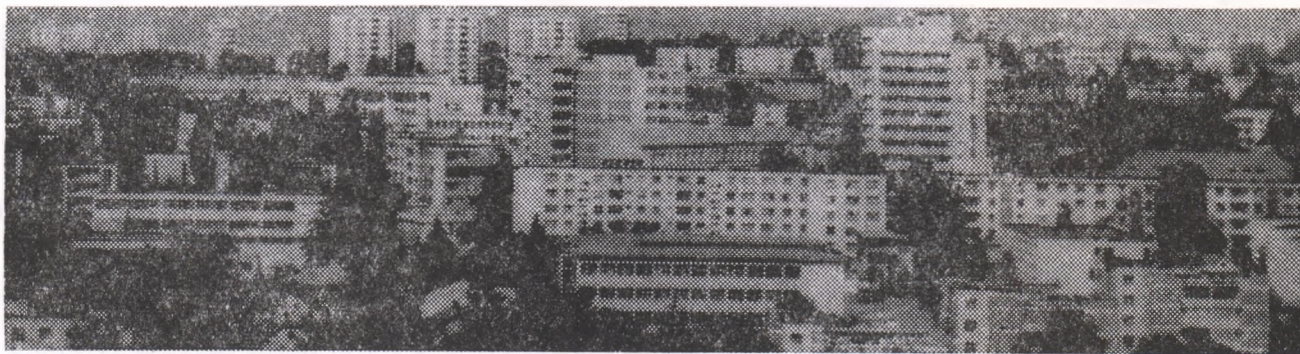
Suceava — azi