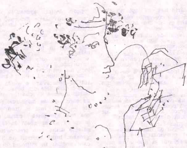
Desen de Ion Carp Fluierici