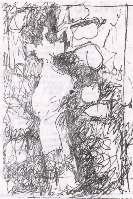
Desen de Mircea Dăneasa