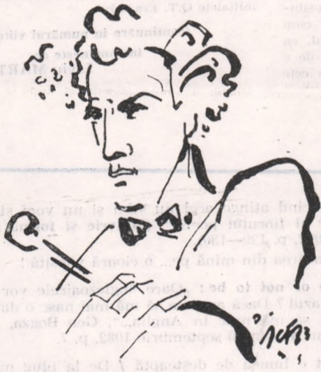
Desen de Ion Carp FLUIERICI

Cu multă maturitate și spirit organizatoric, dar în același timp și cu un bun gust desăvîrșit, Comitetul Arboroasei de sub conducerea lui Ciprian Porumbescu a elaborat un plan foarte exact de desfășurare a ședințelor lunare cu programe frumoase tipărite, cu spectacole periodice. Întrîmirile Arboroasei erau urmărite cu viu interes de toți oamenii dornici de cultură, deoarece aici aveau ocazia să ia contact cu valori ale culturii românești. În marea lor majoritate spectacolele erau structurate pe piese compuse de Ciprian Porumbescu pe versuri proprii, dar își aveau locul asigurată și alți creatori de seamă ai epocii, cum ar fi Vasile Alecsandri, Mihai Eminescu Vasile Bumbac. Interpretarea pieselor era asigurată de membrii Arboroasei, care mai contribuiau la succesul acțiunilor și prin conferințe de interes general. Se poate spune că ședințele-spectacol ale Societății erau așteptate cu nerăbdare de românii bucovineni pentru înaltul lor nivel patriotic și cultural.