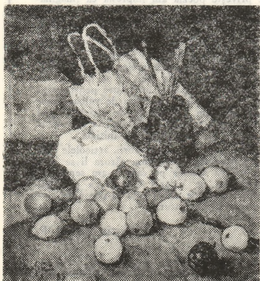
C. AGAFIȚEI: „Natură statică”