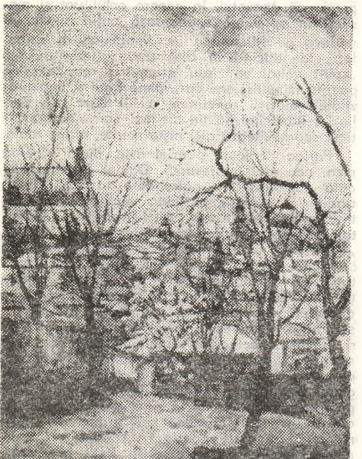
COSTACHE AGAFIȚEI: „Peisaj ișean”