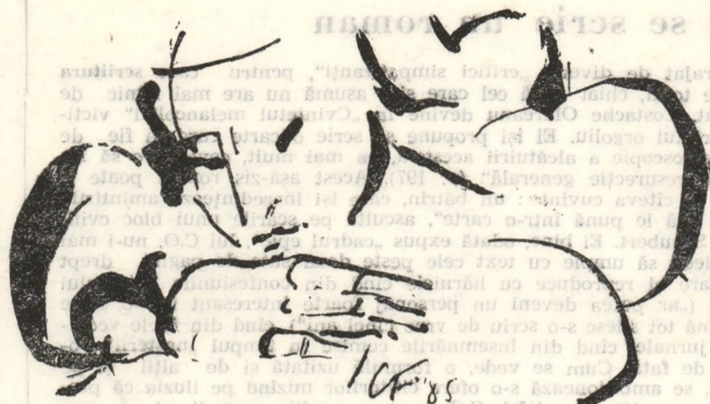
Desen de Ion Carp FLUERICI