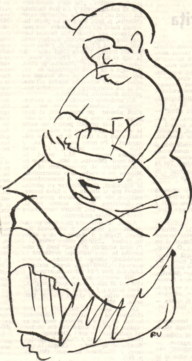
Desen de Virgil PARGHEL