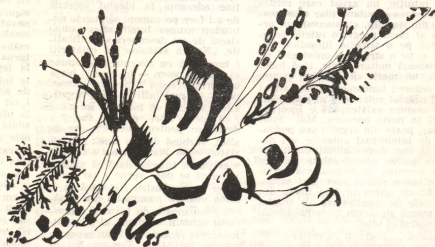
Costin NEAMȚU :