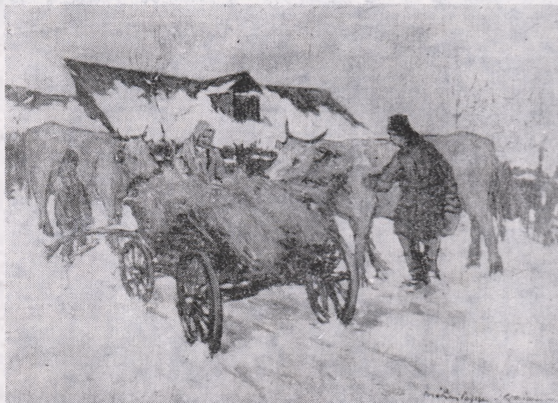
Victor Mihăilescu-Craiu: „Popas” (Din expoziția „Toamna și iarna în pictura românească”)