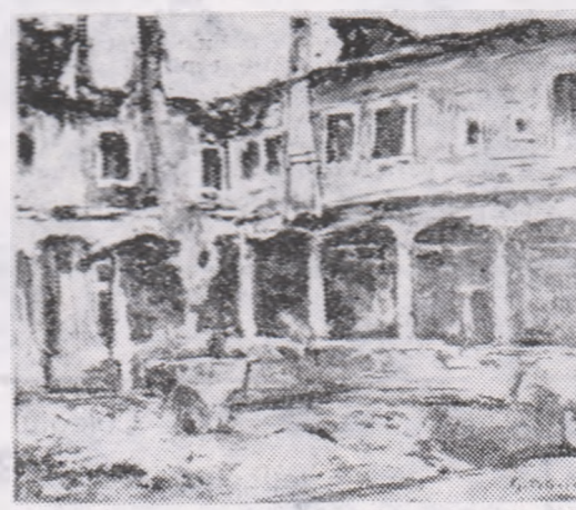
Gh. Petrașcu: „Curte venețiană”