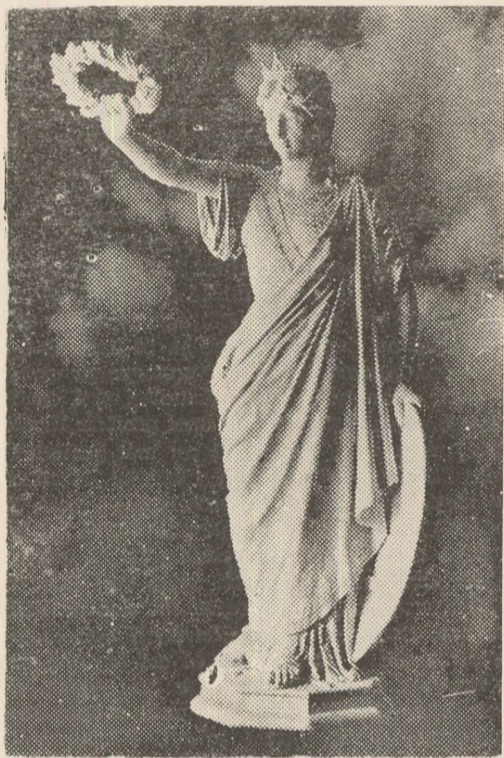
Dumitru Tronescu, unul din primii reprezentanți ai Școlii românești de sculptură

Tebuie spus de la bun început că tradiția impusă de sculptura medievală românească nu conduce direct, din punct de vedere stilistic, la statuare — așa cum îl definește teoria modernă a artei. Fie că ne referim la perioada și arealul influenței bizantine, fie că ne fixăm ca timp și spațiu în sculptura cu destinație utilitară din zonele carpatică, în care se putea produce o intruziune a goticului prin aducerea de meșteri sau de produse ale unor ateliere ale meșterilor și sculptorilor transilvăneni, în ansamblurile arhitectonice medievale românești nu există antecedente de figurare antropomorfă și, cu atât mai puțin, statuare ca manieră de reprezentare a unor artiști de formație autohtonă.