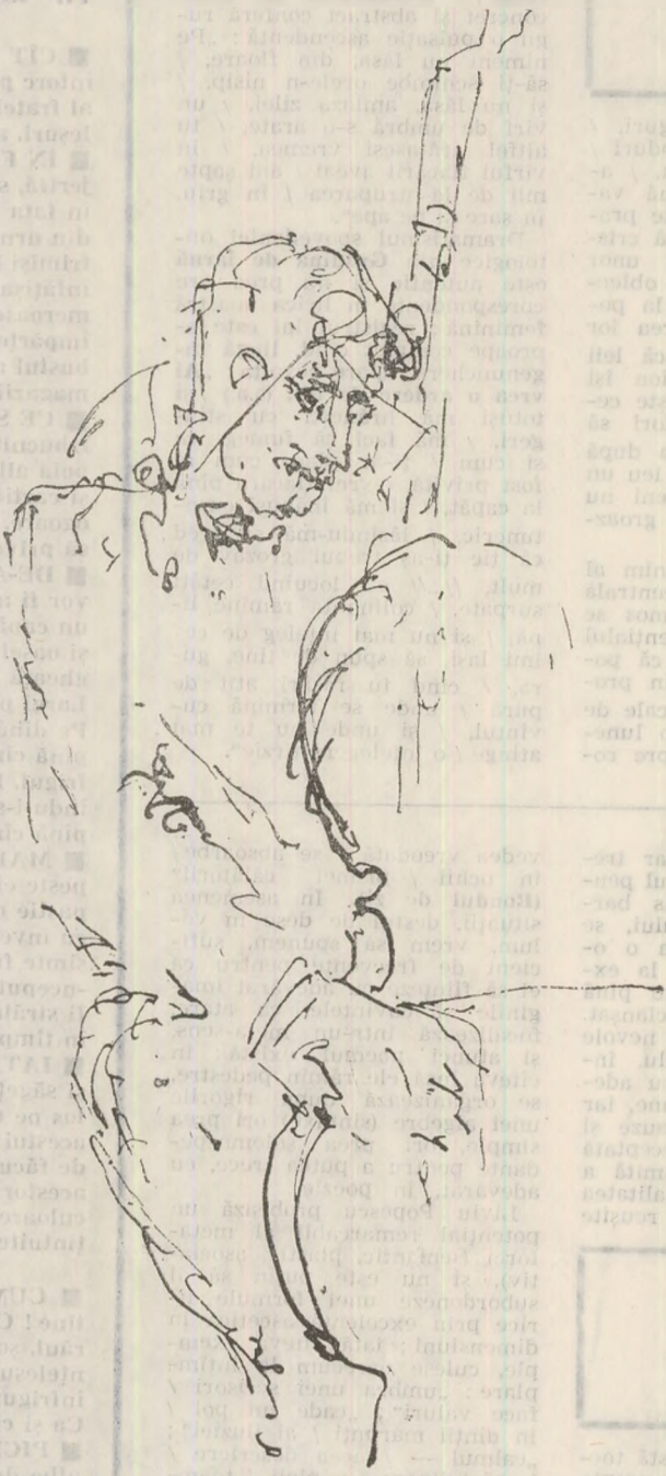
Desen de Ion Carp FLUERICI