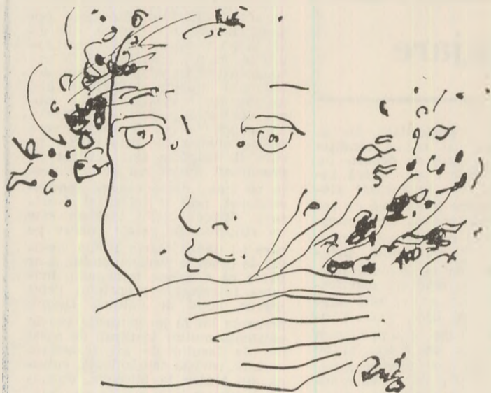
Desen de Ion Carp FLUERICI