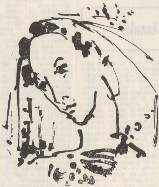
Desen de Ion Carp FLUERICI