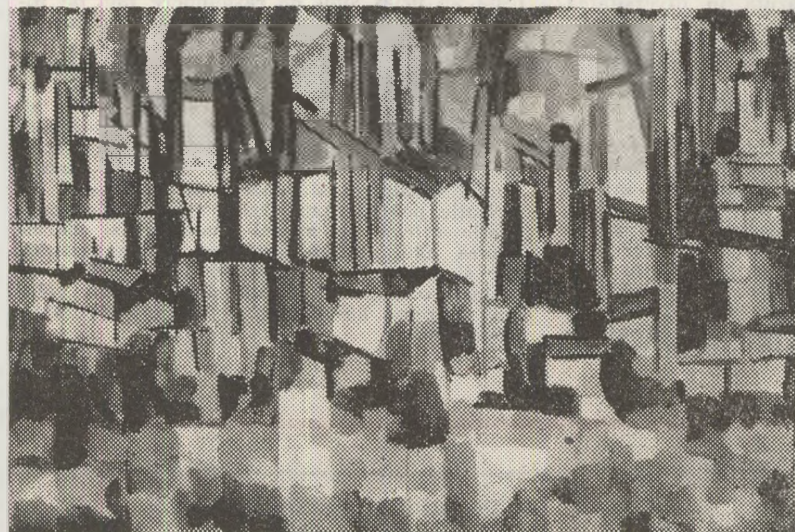
Elena UȚA-CHELARU :

— În notațiile Jurnalului ber- linez, Iacob Negruzzi amintește mereu de flaut: „Am mai cîntat la flaut” (2 dec. 1861); „Nu mă simt în stare să cînt la flaut. Nu știu cum vine asta. Nu reușesc nici măcar un la în octava de mijloc, cel mai simplu sunet de pe flaut! Imi voi da flautul la reparat”. (6 dec. 1861); „Pe cit