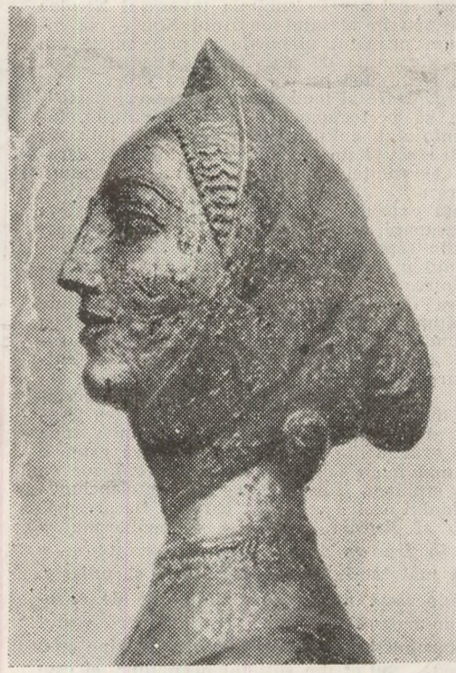
Ion IRIMESCU : „Floarea” (detaliu)