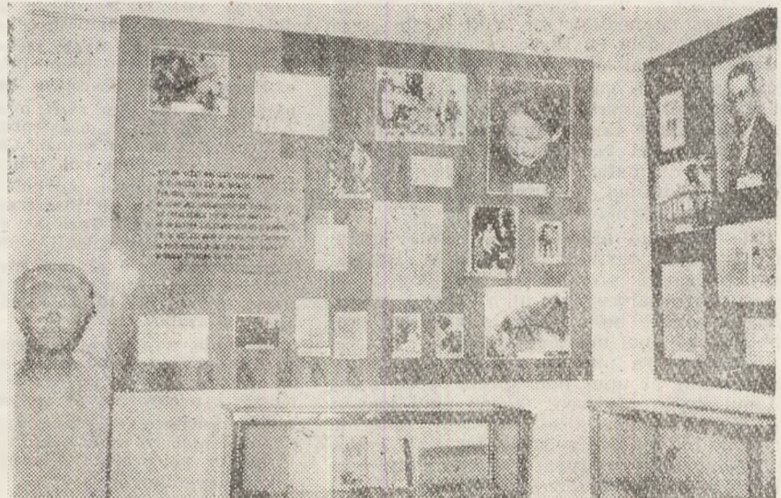
Galeria oamenilor de seamă ai Fălticeniilor