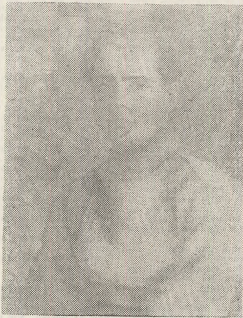
„Autoportret cu peisaj“

Fălticeni și împrejurimile acestuia au constituit, pentru M. Sadoveanu și Aurel Băeșu, prin subiectele pe care în operele acestora le-au determinat, dar și prin structura lor ideativ-afectivă, configurația unei adevărate matrice, sufletești — la care orice cercetare va trebui să se raporteze statornic.