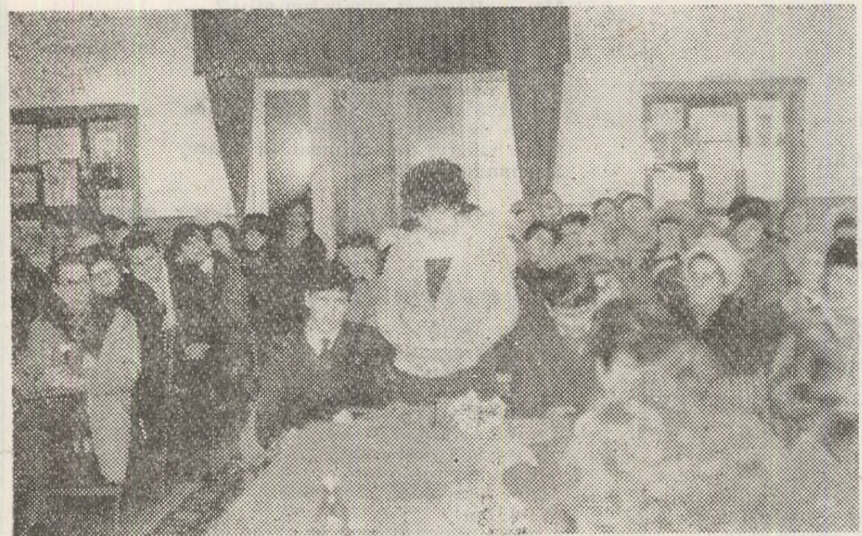
Întîlnirile revistei „Convorbiri literare” la Fălticeni