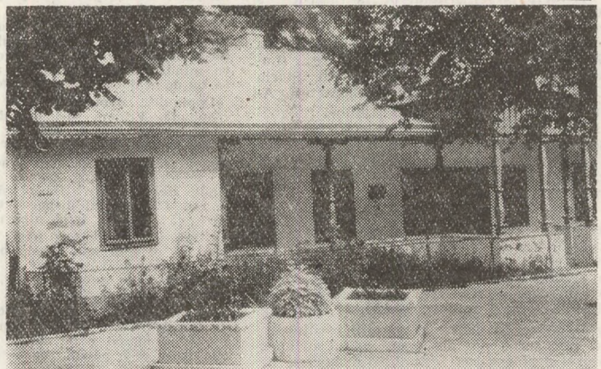
Casa „Nicu Gane — Artur Gorovei” din Fălticeni