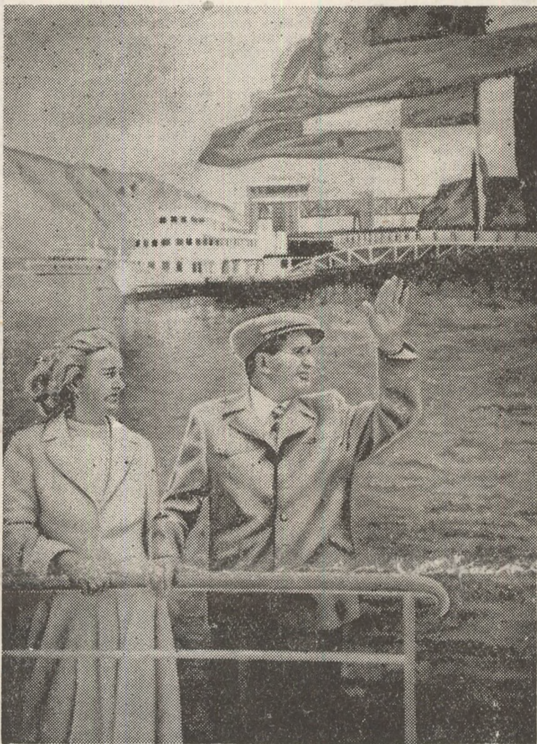
Pictură de Cornelia IONESCU