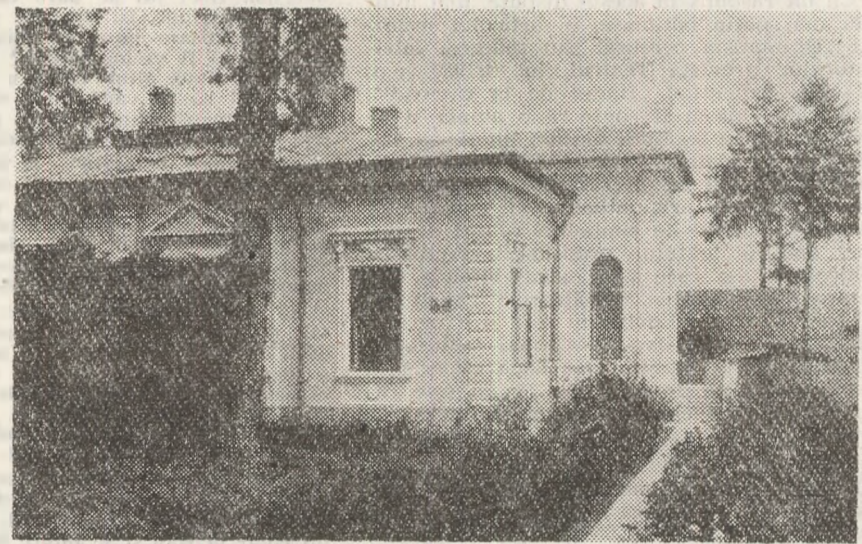
Casa „Eugen Lovinescu” din Fălticeni