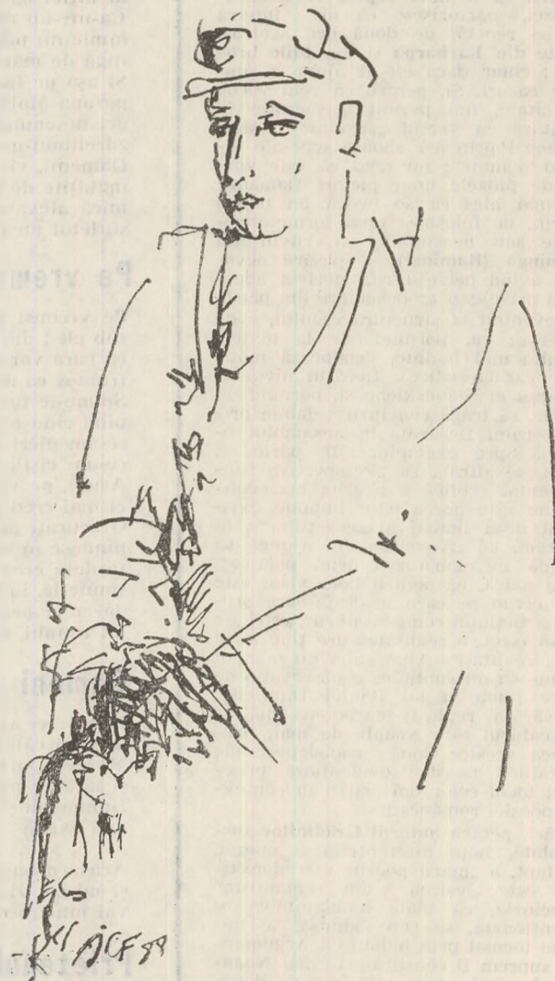
Desen de Ion CARP FLUERICI