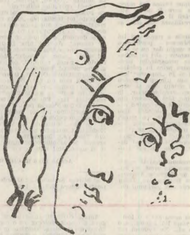
Desen de Ion Carp FLUERICI