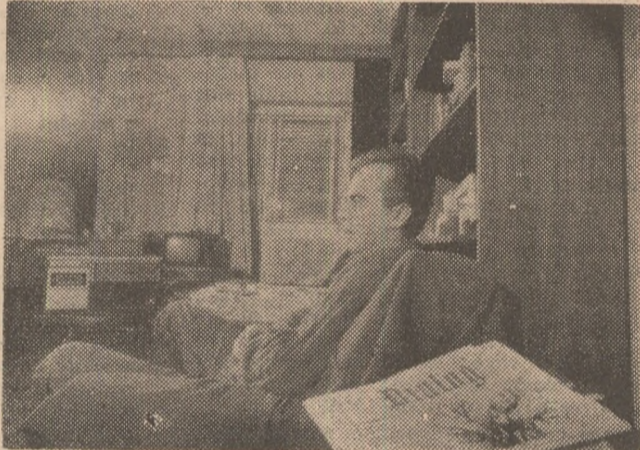
„Ca scriitor, ca membru al Uniunii Scriitorilor, luasem o anumită poziție în cazul unui coleg de-al meu, al unui poet pe care-l prețuiesc”.