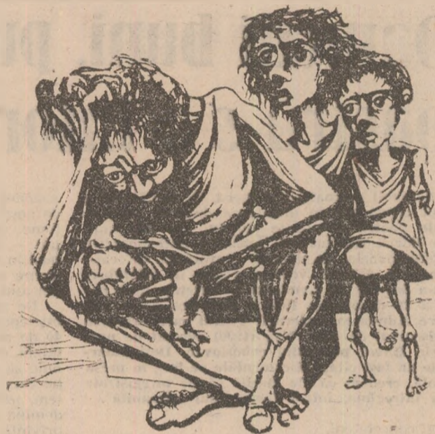
JOSE VENTURELLI Această suferință înseamnă ură — litografie, 23 x 24 cm.

mandînd ca vocea „dublului dizident” să fie ascultată și de cei care au asaltat puterea de a influența mersul lumii 9 . Nu e greu de sesizat acordul dintre o asemenea pledoarie, făcută într-o metropolă culturală a lumii noi și alte mesaje resurecționale emise pe vechiul continent. Malraux nu vedea nici el o altă șansă pentru umanitatea de mîine, ca și alți filosofi din veacul nostru. Das Prinzip Hoffnung, proclamat de Ernst Bloch, ține de aceeași febrilă căutare a unei ieșiri pe calea spiritului 10 . Reflecțiile lui Soljenin pe acest tărîm nu sînt singurele ce pun în cauză civilizația apuseană. A. Zinoviev e la fel de critic în analizele întreprinse pe seama aceluiași fenomen, dar mai puțin tonic și prevede chiar o posibilă evoluție a lumii apusene spre o societate de tip comunist, ceea ce nu lasă mare loc speranței de armonie universală 11 . Din contra, căutînd o cale de ieșire a Rusiei din criză, Soljenin constată mai întîi că „a sunat ceasul comunismului; totuși colosul de beton n-a fost încă distrus. Cum să ne eliberăm de el fără a fi zdrobiți sub ruine?” 12 Scriitorul lansează de aceea un nou manifest, larg difuzat prin „Komsomolskaja pravda”, în care ia atitudine față de politica imperialistă a Uniunii Sovietice, politică susceptibilă a nutri mai departe tensiuni între marile puteri, recomandînd întorcerea la valorile rusești tradiționale. Aceasta înseamnă, explicit, secesiunea de republicile neslave, reforme adînci în toate