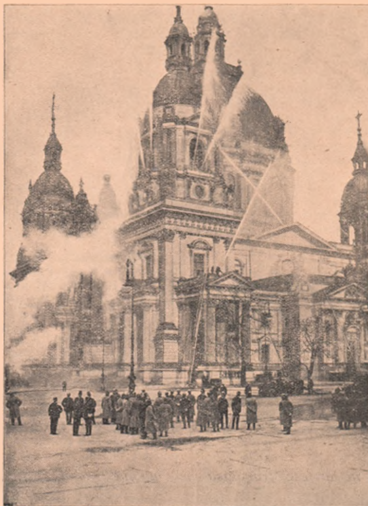
Probă de pompieri, făcută în jurul Palatului Regal din Berlin. Urcați pe ferestrele cupolelor și pe felurite puncte ale coperișului, de acolo azvârl raze puternice de apă în sus și 'n jos, ca în luptă cu focul! — Proba e făcută pe frontul de Sud al Palatului.

Vermele greu atins, nu poate să-și întoarcă botul înapoi ca să se apere. El se întoarce mereu pe spate, se rostogolește când pe o parte când pe alta, pe când furnica îl ținea mereu