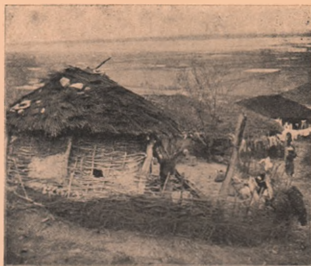
Vederi din Durazzo, reședința Domnitorului Albaniei. Chipul dela stânga ne prezintă vederea unui castel, și a unui turn vechiu de apărare, din partea frumoasă a orașului, — la dreapta însă un chip din partea săracă a orașului, din așazisul suburbiul grecesc, care arată sărăcie mare.