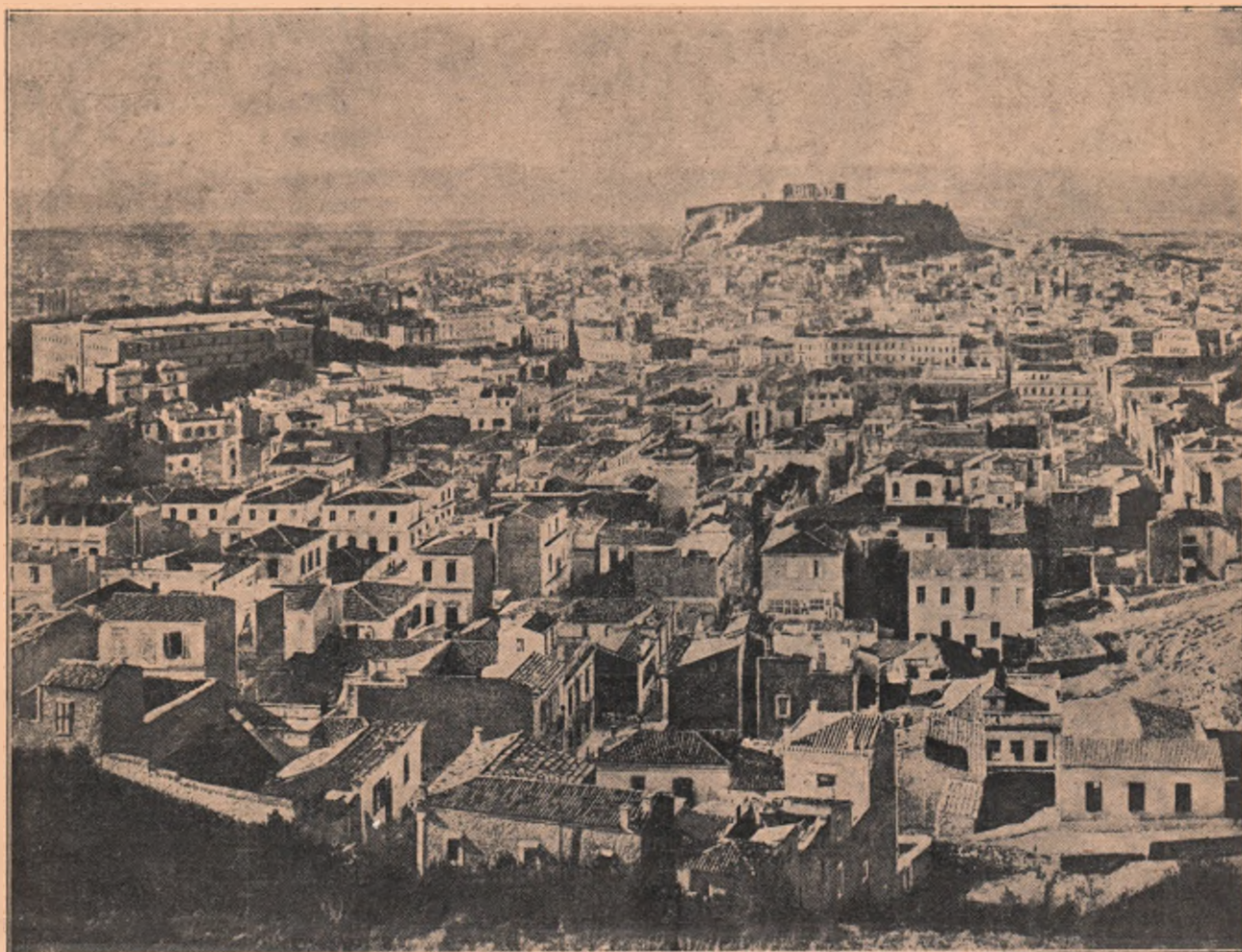
Atena, vederea generală a capitalei grecești, — de unde vine zitele astea iar la București Prințul George, cel care are dorul fierbinte a duce în țara sa de insule pe frumoasa Prințesă română Elisabeta.