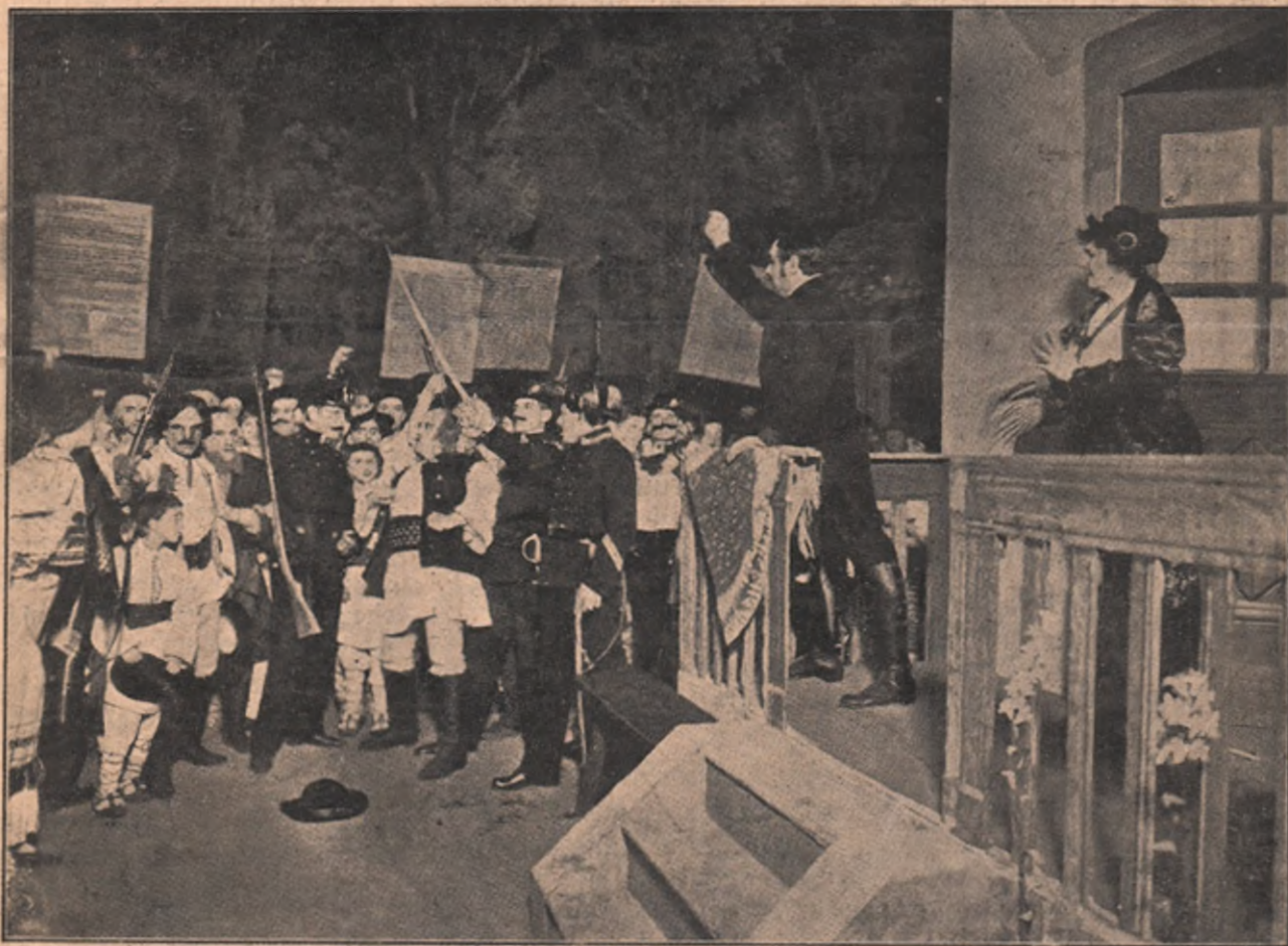
O scenă din drama „Domnul Notar“ a poetului Goga, jucată pe scena Teatrului Național din București, cu mare succes de repetite ori.