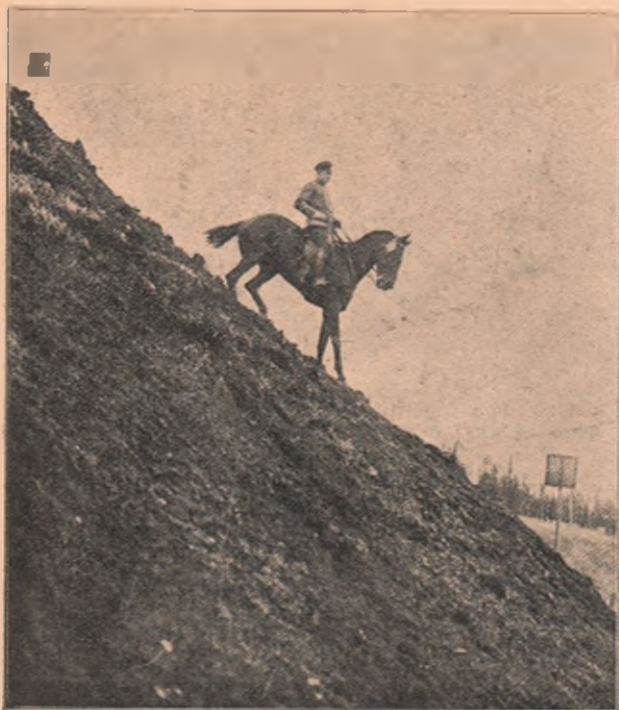
O parte grea de călărit, pe un țipiș, care pune la probă istețimea calului și a călărețului, de a umbla pe drumuri rele...

rele scumpe de Persia, și ele erau împodobite cu covoare de ale fabricii din Herekeh, proprietatea Sultanului, despre cari știu că nu-s infectate cumva cu bacterii molipsitoare. (Așa se teme el de toată lumea din jurul lui, încât și un covor luat din streini îl bănuie că ar fi infectat pentru a-i duce vre-o primădie scumpei lui vieți.)