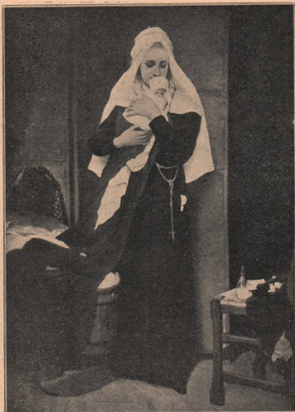
Copilul găsit... tablou, de Gabriel Max.

team înainte... cu sufletul ușurat... Mă vedeam înaintea apoi în dosul bisericii, dar nu mai eram eu... cea de odinioară.