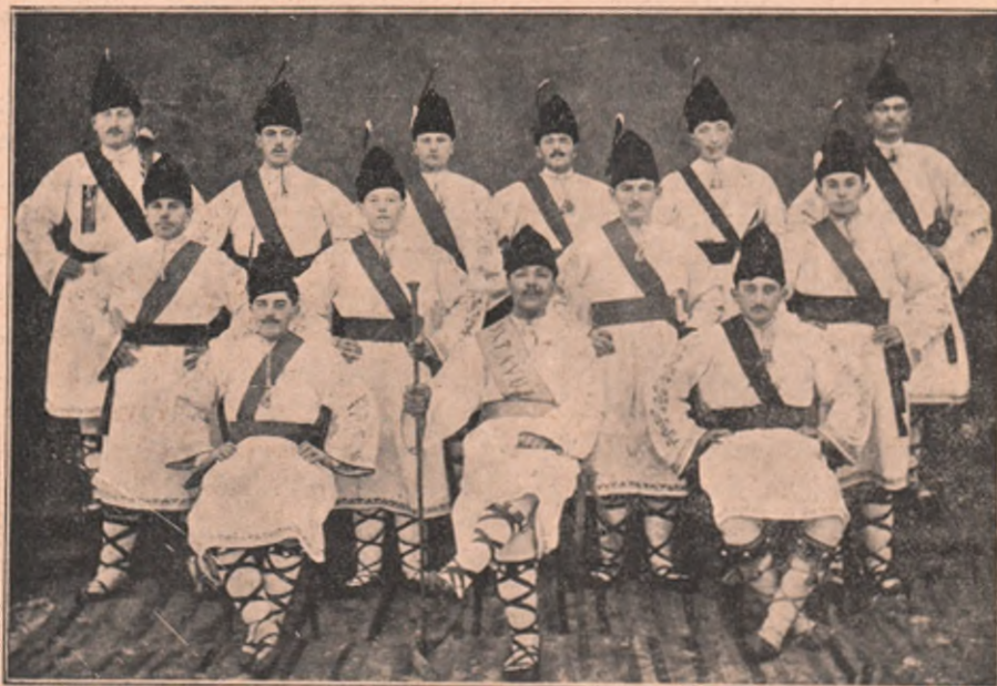
Cel 13 juni din Comloșul-mare cari la sărbarea desvălirii Tabloului „Vlaicu-Goga” au împodobit producția jucând eroicele jocuri naționale „Călușerul și Bătuta”.

O credință generalizată în Albania e aceea a prevestirilor de nenorociri: dacă pe osul unui piept de puiu sunt puncte roșii, e un semn