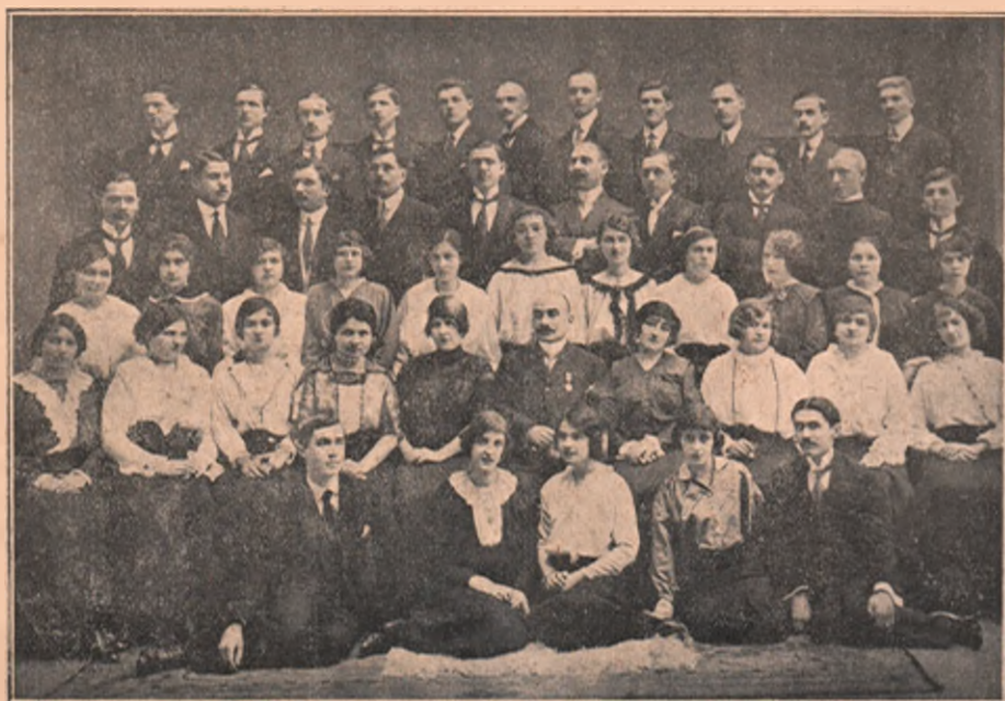
Reuniunea română de cântări „Illlaria” din Oradea-mare.

neîndoiros că nu va trece mult și va fi războiu, dacă pe acelaș os se descoperă o gaură, e semn că va fi în curând un mort în familie. Codcădăitul găinei în anumite condițiuni, troznetul mobilelor la anumite ore, sunt deasemenea prevestitoare de o nenorocire apropiată.