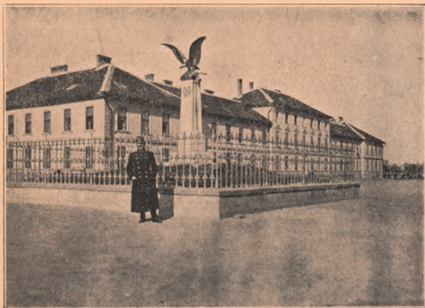
Vedere din Orăștie : Monumentul din curtea casarmei orășenești, ridicat întru amintirea luptei dela Biskupitz, unde regimentul românesc 64. a săvârșit o splendidă bravură războinică.