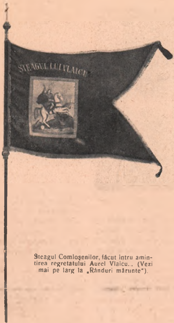
Steagul Comloșenilor, făcut întru amintirea regretatului Aurel Vlaicu... (Vezi mai pe larg la „Rânduri mărunte”).