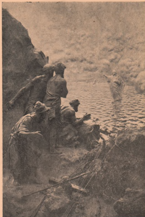
Isus pe mare, venind spre învățăcelii săi, cari abia-și puteau crede ochilor. Petru a zis: „Învățătorule, poruncește-mi mie să viu și eu pe apă”. Și Isus i-a zis: Vino. Și a mers Petru, dar dela o vreme, cuprinzându-l frica, a început a se scufunda. Atunci i-a zis Isus, spriginindu-l și mântuindu-l: „Puțin credinciosule, de ce te-ai îndoit?...”

la litii , procesiuni bisericești, și la înmormântări de frunte, petrecut de 12 copii cu ministranți.