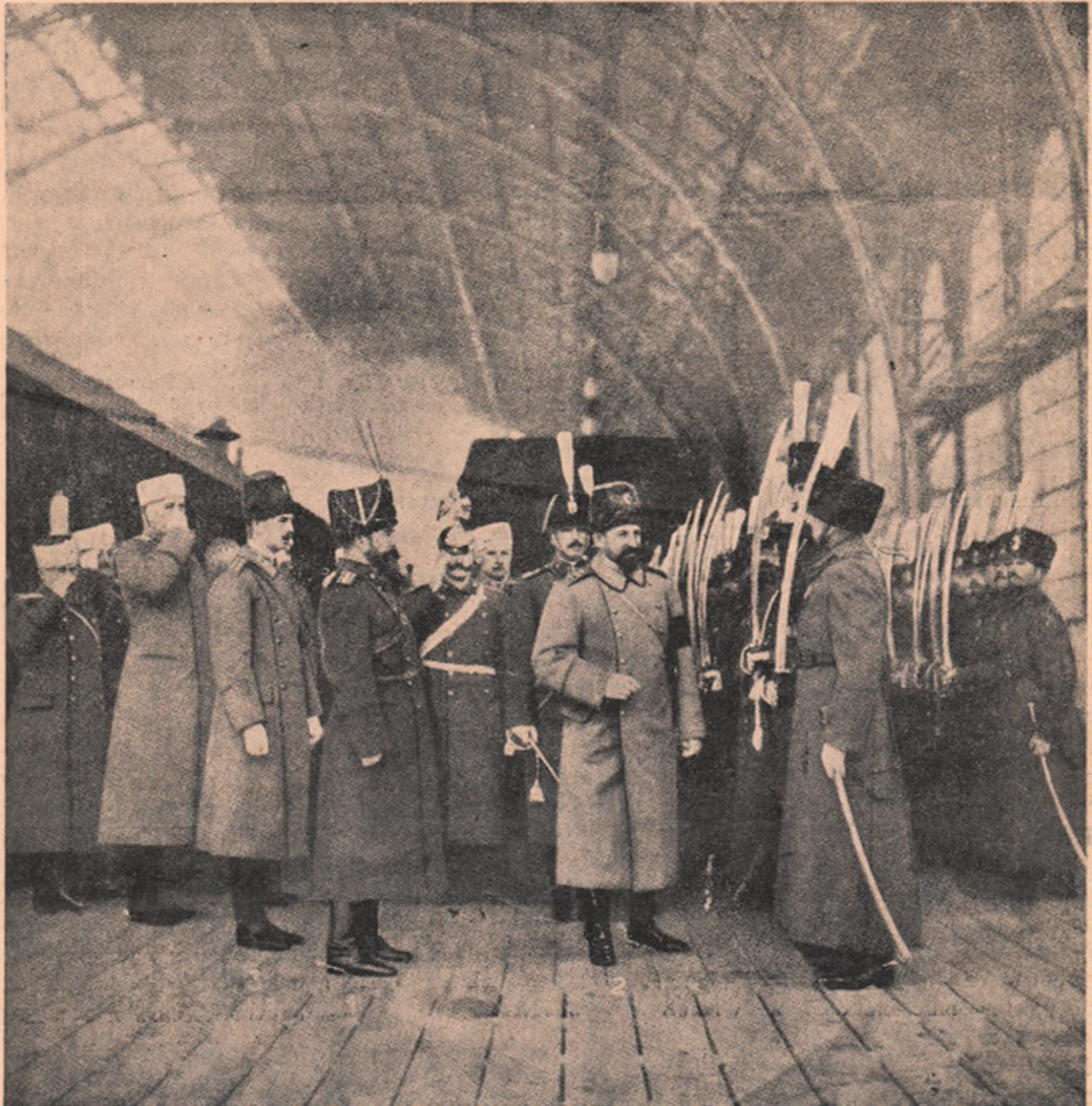
Primirea la Petersburg a Prinșilor români: Cel cu nr. 1 e Țarul Nicolae, nr. 2 e Principele Ferdinand, primind salutul companiei de onoare, de Cazaci, ce i-au ieșit la gară, nr. 3 e Prințul Carol, purtând uniforma de ofițer rusesc, — în colo generali și curteni împărătești.

bacherea în mână. Numai târziu, când m-a luminat, am înțeles, că ilaritatea s'a produs pe motivul, că i-am înlins mâna chelnărului. Că ce e de râs în aceea, că dăm mâna cu un om asemenea nouă, fie acela chiar chelnâr — asta n'o înțeleg cu mintea mea de japonez, nici în ziua de azi.