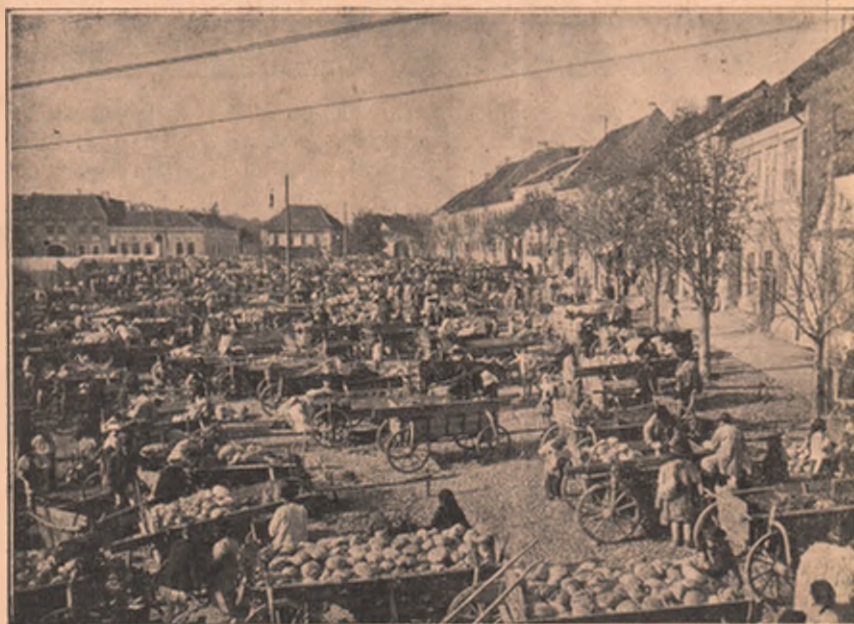
Vedere din Orăștie : Târgul de varză în piața mare, toamna.

Se spune, că în Europa stima față de femei a prins rădăcini de pe vremea cavalerismului. Că de ce trebuie deosebit slămată femeia, asta nu intră în capul meu japonez. Omul stimează deosebit pe un poet mare, pe un om genial, pe un comandant celebru, pe domnitor, dar pentru ce se cuvine acest respect