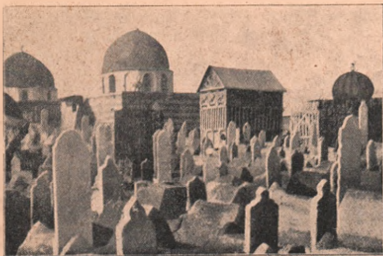
Cimitirul din Damasc, cu mormintele fiicei și ale celor două soții ale lui Mahomed.

convertirea lui Sf. Pavel; în evul mediu, însă, tradițiunea indică locul convertirii în apropiere de satul Kokah. Tradițiunea musulmană mai indică în apropiere de Damasc, locul unde ar fi petrecut câțva timp Adam, unde Avel a fost ucis de Cain, și unde Abraham a avut revelațiunea Dumnezeului unic.