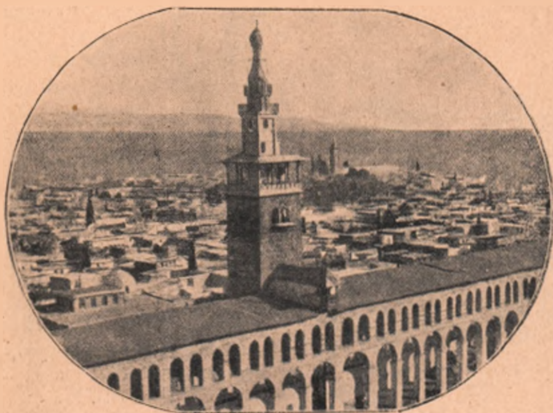
Marea Moschee a Omniazilor din Damasc.

populațiunile din interior sunt terorizate de un mare număr de fiare, cari în fiecare zi făceau număratoase victime. Norodul, îngrozit, se adresă atunci unui Libanez trecut la creștinism, spre a-i cere sfat. Și convertitul îi sfătuiește, să se ducă la Sfântul, care singur putea să-i salveze. O deputațiune de Libanezi s'a dus la Sf. Simeon Stilitul, care le-a spus: