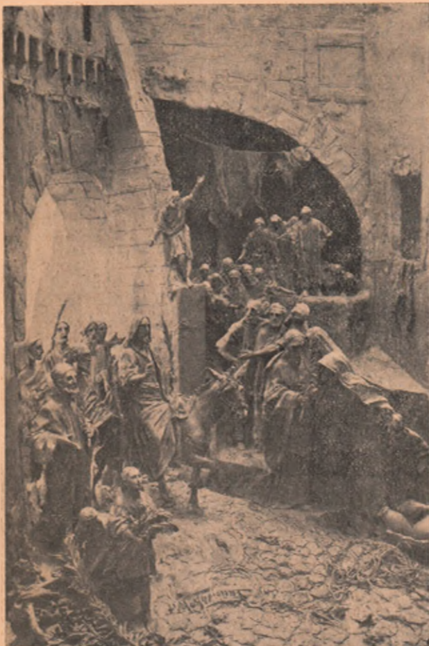
Isus intrând în Ierusalim. Poporul îl primește cu închinăciune mare, așternându-și hainele în drumul lui, pentru că peste 4 zile același nenorocit popor să strige sălbatec: „Răstignește-l, răstignește-l!”