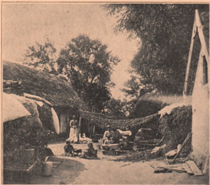
Uscarea tăbăcului: vedere din Feldebrő, comitatul Heveş; întinderea foilor pe ațe pentru uscat.