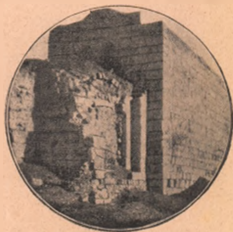
Fortăreața din Damasc, cu fereastra pe unde, după cum zice legenda, ar fi scăpat din închisoare sf. apostol Pavel.

Numele de Damasc aduce aminte, firește, pentru creștini, amintirea convertirii Sfântului Apostol Pavel . Călăuza vă arată cu cea mai mare convingere nu numai mormântul Sfântului care a înlesnit fuga lui Sf. Pavel, dar și fereastra prin care creștinii au scoborit pe Apostol într'un coș, în timpul nopții, (vezi chipul de jos). Călăuza își mai arată, la o mică depărtare de Damasc, locul unde s'a săvârșit