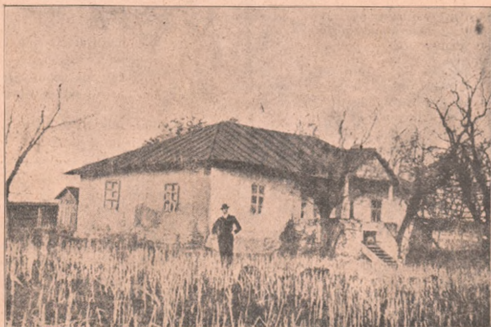
Casa din Ipotești, unde s'a născut Mihail Eminescu, la 15 Ianuarie, 1850.