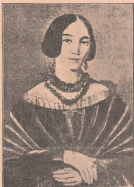
Mama lui Eminescu.