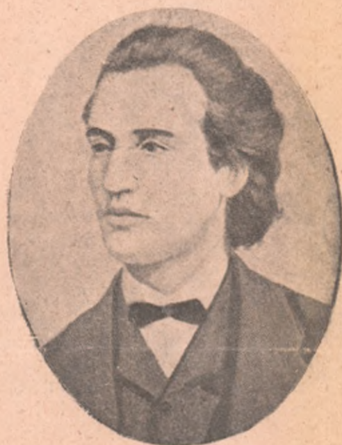
Eminescu la 20 de ani.