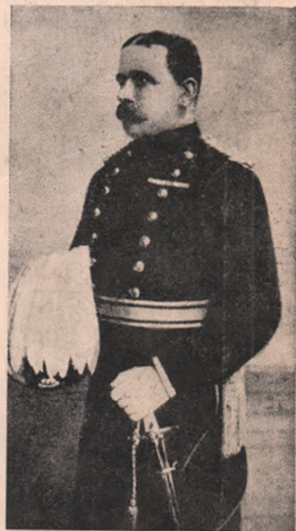
Feldmarșalul englez Sir John French, comandantul armatelor unite franco-engleze din Nordul Franciei, — cari fac împotrivirea la năvala germană ce vine pe aci, din Belgia, înaintând asupra Parisului.

— Sfinte Petre, am venit aici în împărăția păcii. N'am mai putut stă acolo, jos. S'au sculat împărați peste împărați, crai peste crai. Pământul e greu de oști și văzduhul de zborul gloanțelor ucigătoare. În vuetul războaielor, glasul meu slab a amu-