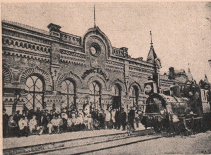
Gara dela Noua-Suliță (Nowoselnitza) comuna rusască de hotar, la care se împreună hotarele alor trei țări: a Rusiei, a României și a Austriei. — În jurul acestei comune s'au dat multe lupte între armatele austro-ungare și cele rusești. De multe ori ale noastre au trecut din Noua Suliță încolo, apoi iar Rușii încoace, ca valurile unor ape ce se întâlnesc furioase.

cearcă în tot chipul să încunjure locurile primejdioase, totuș, numărul corăbiilor ce se războiesc acum, fiind neasămănat mai mare ca în războiul japonez, ne putem aștepta în războiul de față la colosale jertfe pe mare.