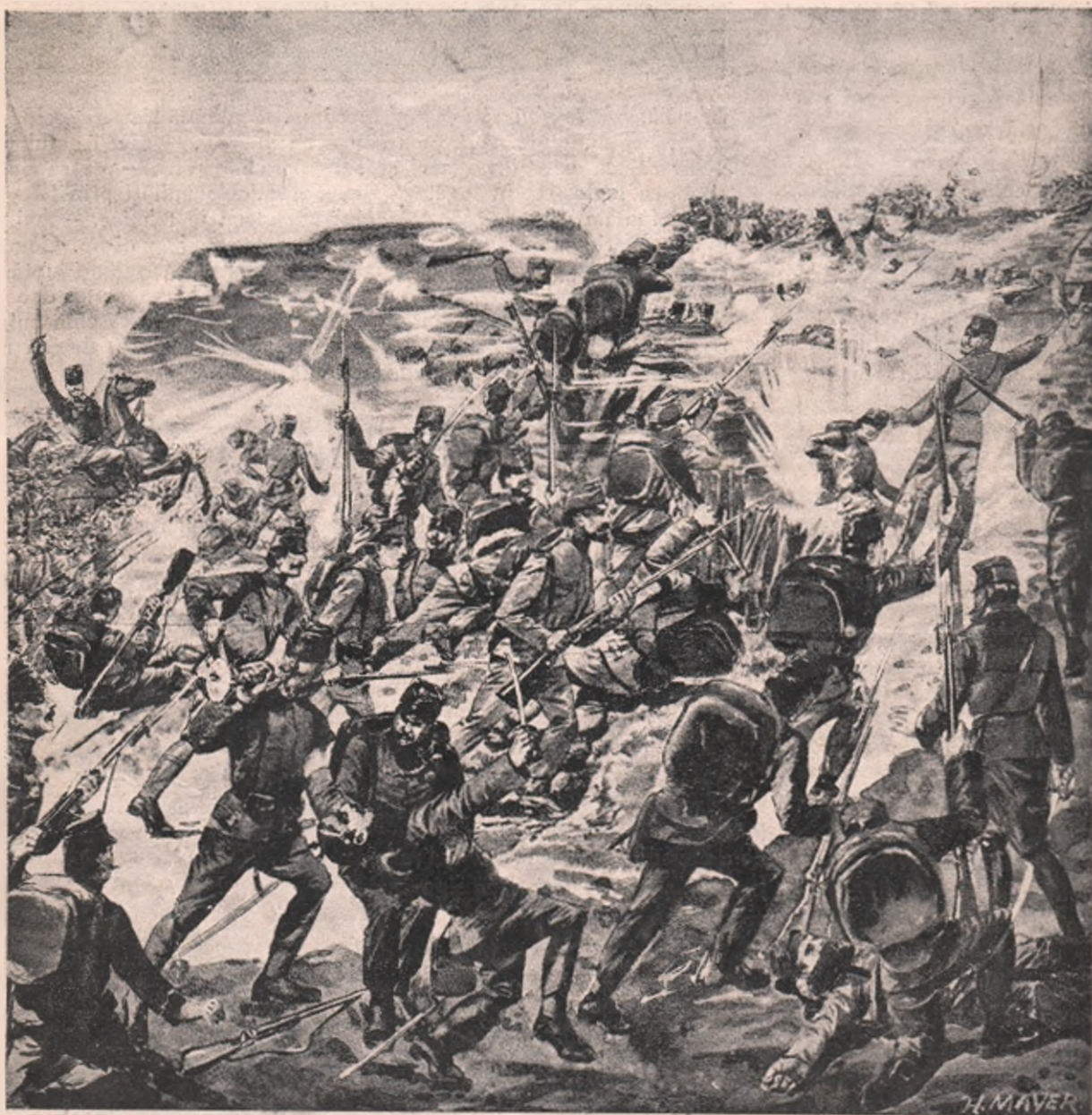
În toiul cel mai mare al luptei! — Icoana unei lupte date de trupele din centrul armatei noastre din Galiția, în împrejurimile Lembergului, contra năvalei dușmane mult mai numeroase!