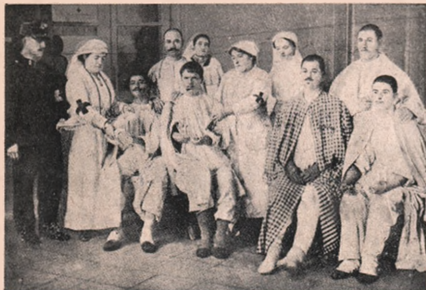
Cei dintii răniți, aduși la Budapesta de pe câmpul de luptă și luați în grija lor de ajutoarele „Cruții Roșii”, care i-a logat și îngrijit.

țit. Sufletul mi s'a strâns de groază și am plecat. Trimiteti pe altcineva mai tare. Eu am fost omul blândetii, și cu cea dintâi bubuitură de tun mi-am încheiat rostul. Vreau să mă odihnesc. Sunt obosit. Să nu mai aud zgomotele crâncene de jos. Pri-mește-mă, sfinte Petre!