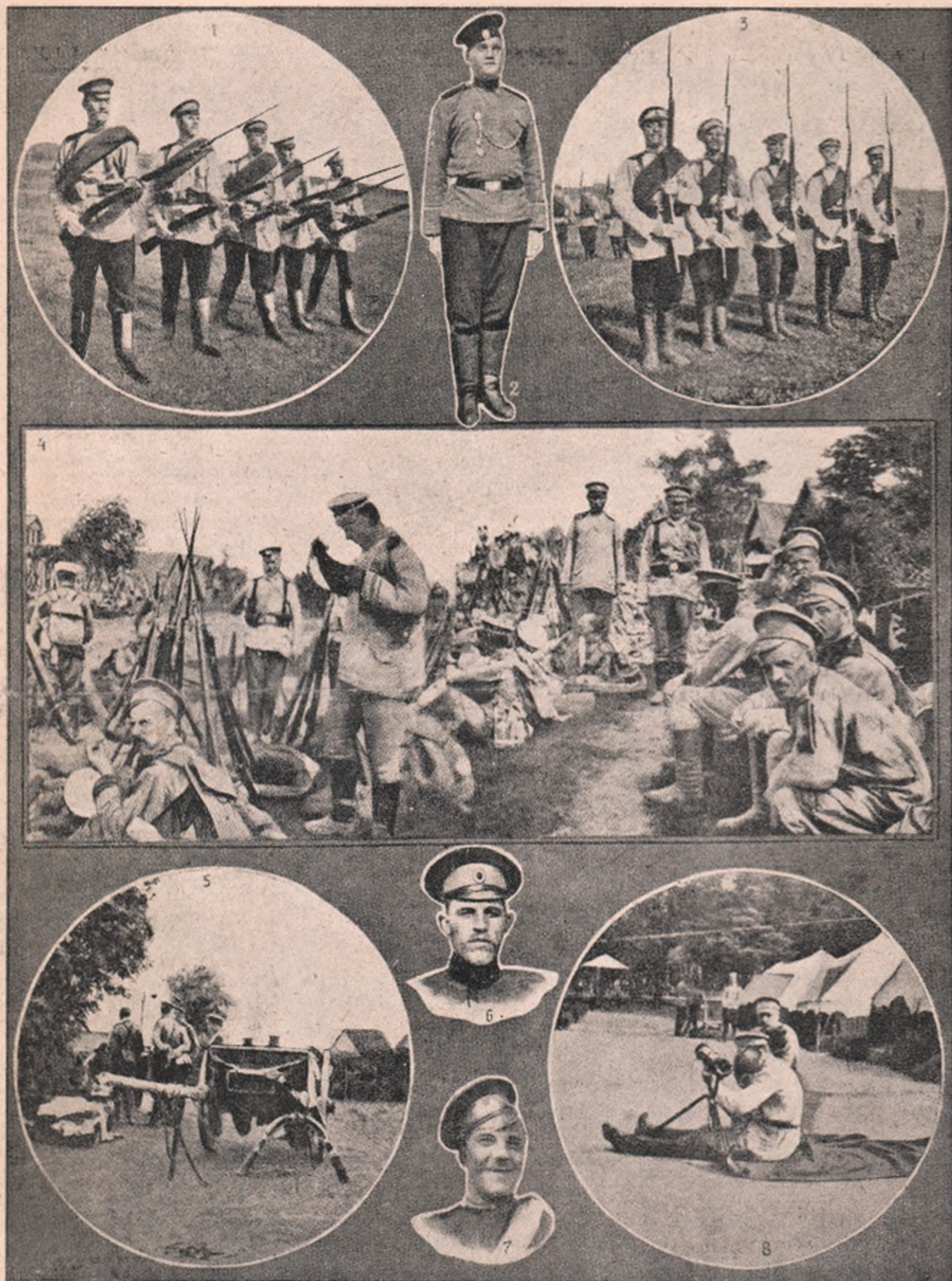
Vederi din armata rusească: Chipul de sus de sub 1. ne arată infanteria rusească, înarmată cu pușcă cu repetiție, dar cu baionete mai lungi ca ale puștilor noastre. — 2. Soldat rusesc în starea „drept!” („haptac”). — 3. Infanteriștii făcând salutarea cu arma. — 4. Vedere din tabăra rusească, în vreme de odihnă. — 5. Trăsura de cărat hrane. — 6 și 7. Tipuri de soldați ruși. — 8. Ofițer spionând depărtările cu ochianul.