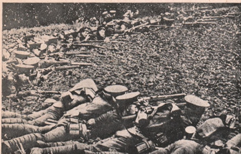
Infanterie engleză, în luptă.

fără nici o valoare, ori de foarte puțină valoare erau cumpărate pe întrecute și pentru sume de necrezut. Pentru banii rusești , s'au dat prinsonierilor prețuri terifiante. Eră a adevărată bursă de suveniruri rusești și eră rușine să nu aibă omul măcar o rublă rusească.