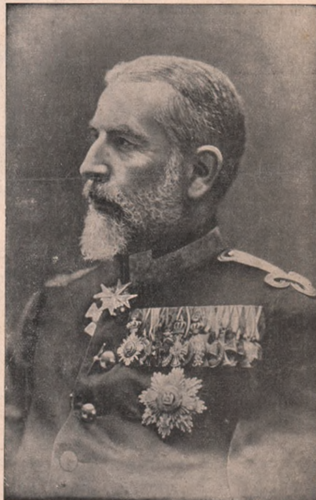
VECHIUL REGE AL ROMÂNIEI: CAROL †