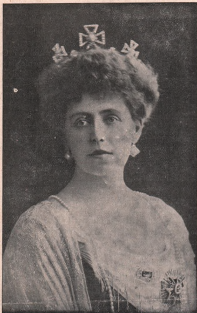
NOUA REGINA A ROMÂNIEI: MARIA

plângându-l cu lacrimi sincere pe marele lor Rege, cu care se deprinsese așa de mult, timp de jumătate de veac, încât i se părea că nici odată nu va putea să-i părăsească..