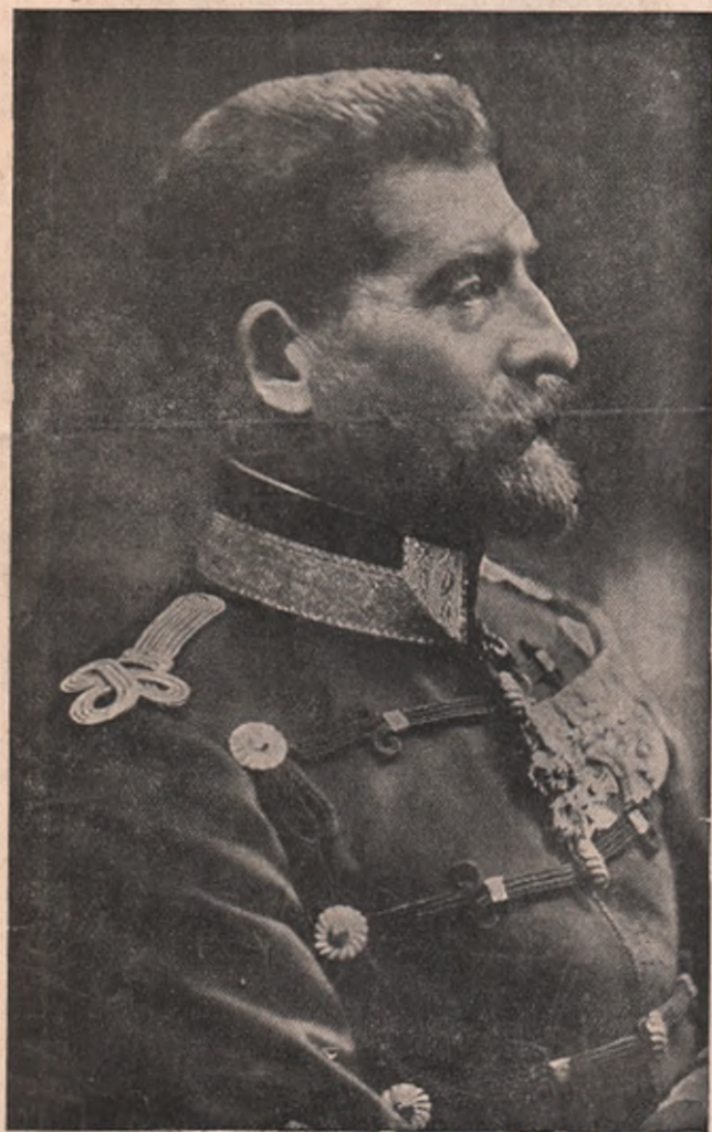
NOUL REGE AL ROMÂNIEI: FERDINAND I.