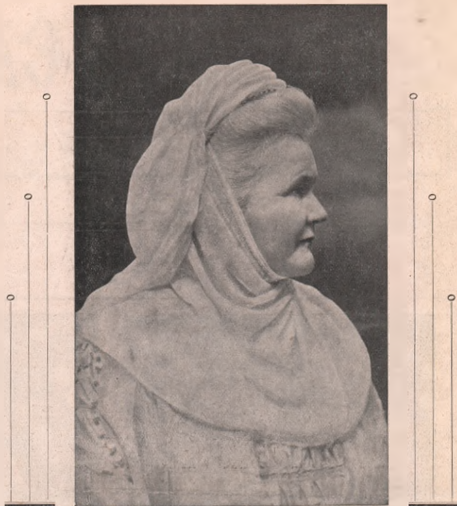
VĂDUVA REGINĂ: ELISABETA

În curtea inferioară a palatului cosciugul a fost depus pe un afet de tun din reg. 19 artilerie, tras de