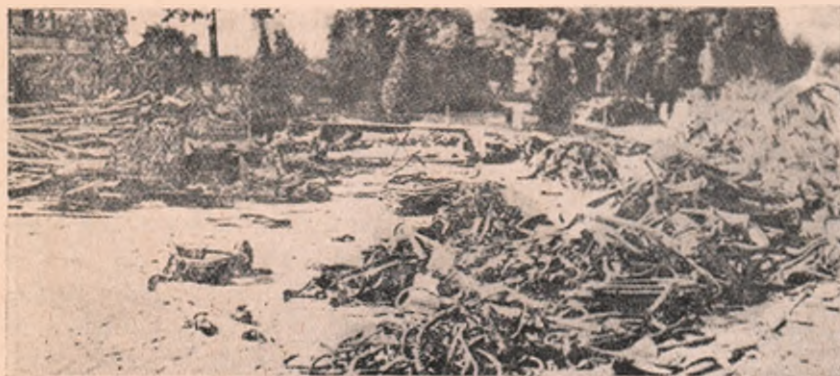
După lupta dela Longwy (in Franca) sfârșită cu zdrobirea orașului, — așa au rămas clae pe grămadă sfărâmate în un parc al orașului tunuri, cară de muniții și alte lucruri de războiu, cum se văd în acest chip.

stricate de cătră Ruși firele telegrafice. Dupăce năvălitorii au fost alungați, impiegații noștri de telegrafic, le refac.