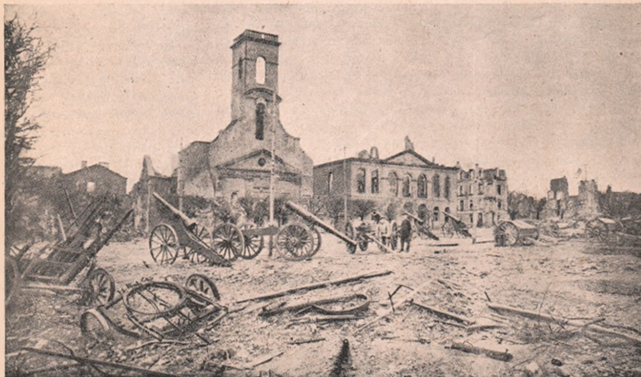
Altă vedere din orașul francez Longwy, tot zdrobit de artileria germană în acest războiu.