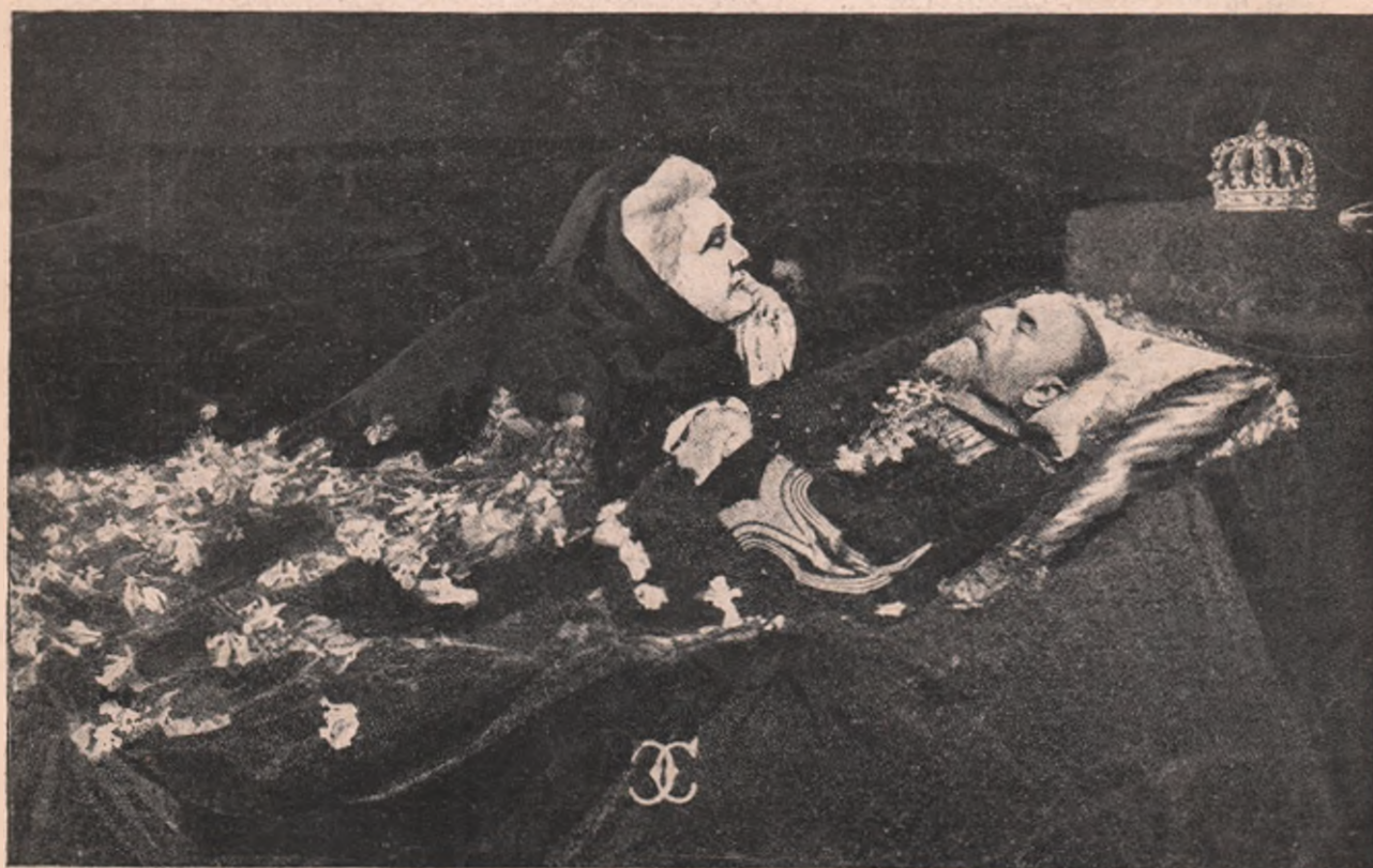
Regele Carol pe catafalc; Regina ingenuchiată lângă sicriul lui și Coroana de oțel strălucind la capul lui...