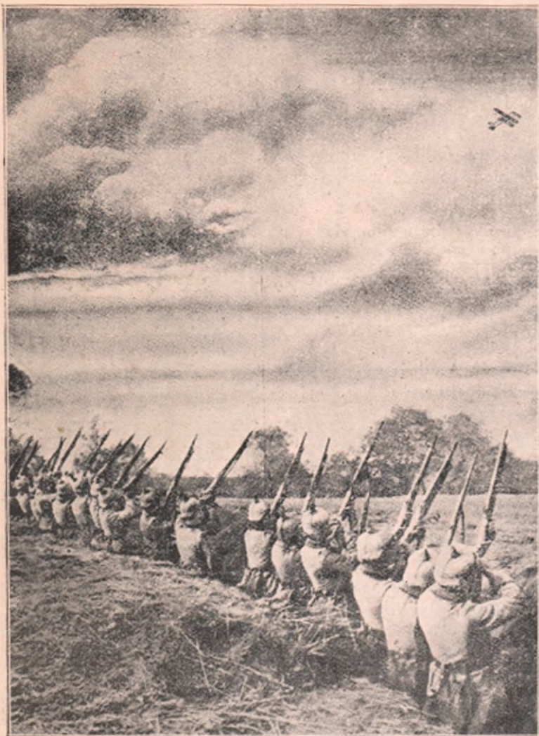
Trupe germane trăgând salvă de pușcături după o mașină de zburat rusească ce trece peste câmpul lor și le spioncăză așezările.

ranjat un șir de mese unde s'a servit, un prânz învățătorilor și primarilor din țară veniți cu toții la înmormântare, ca trimișii satelor lor. Alături, de-asemeni, un alt șir de mese cu 3500 locuri, unde au prânzit țărani din împrejurime.