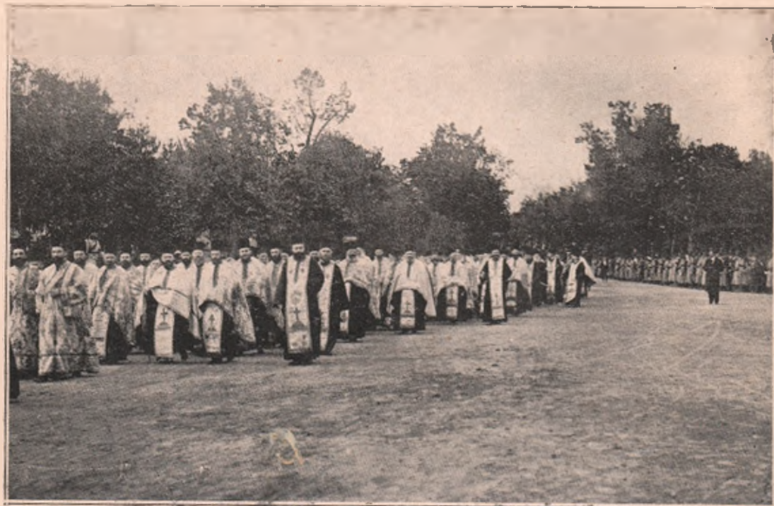
Preoțimea care a servit la înmormântarea Regelui Carol, cu cei 2 Mitropoliți ai Țării, în frunte.

țele omenești ale Regelui mort ar fi fost depuse în sala Tronului, doliul ar fi acoperit această sală, deci și Tronul regal.