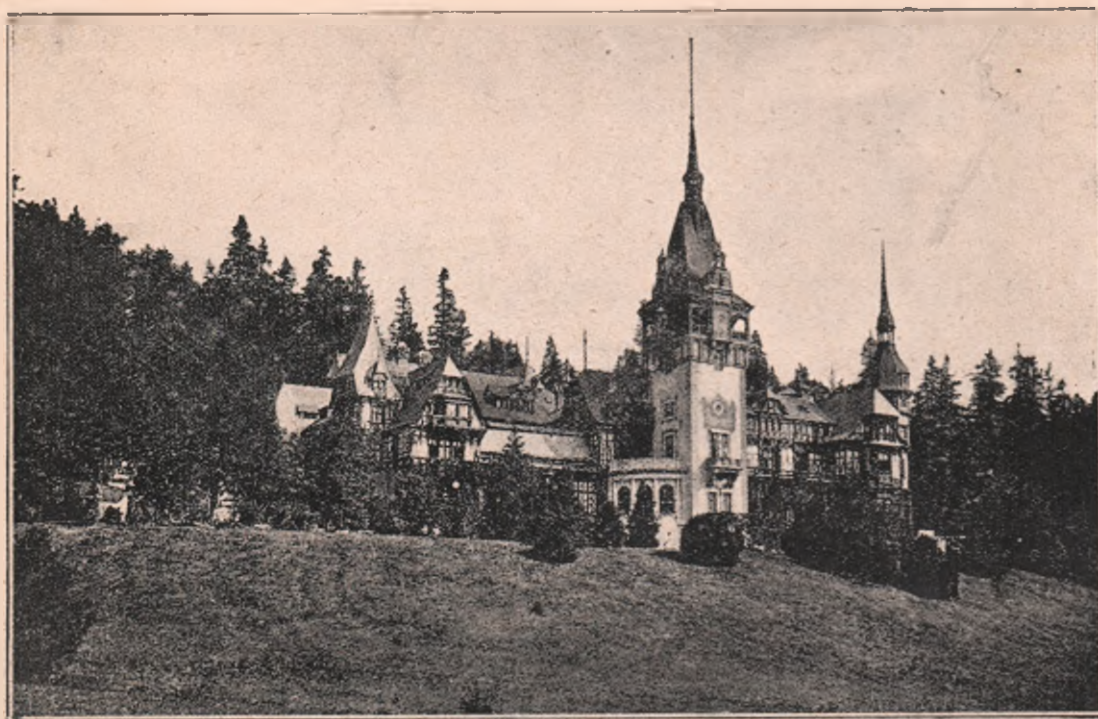
Castelul Peleş dela Sinaia, în care Regele Carol a apus dintre cei vii...

ce veniseră și se îmbulzau care mai de care să ajungă a străbate în Curte spre a vedea catafalcul, a mai vedea odată pe acel care a fost Regele Carol!