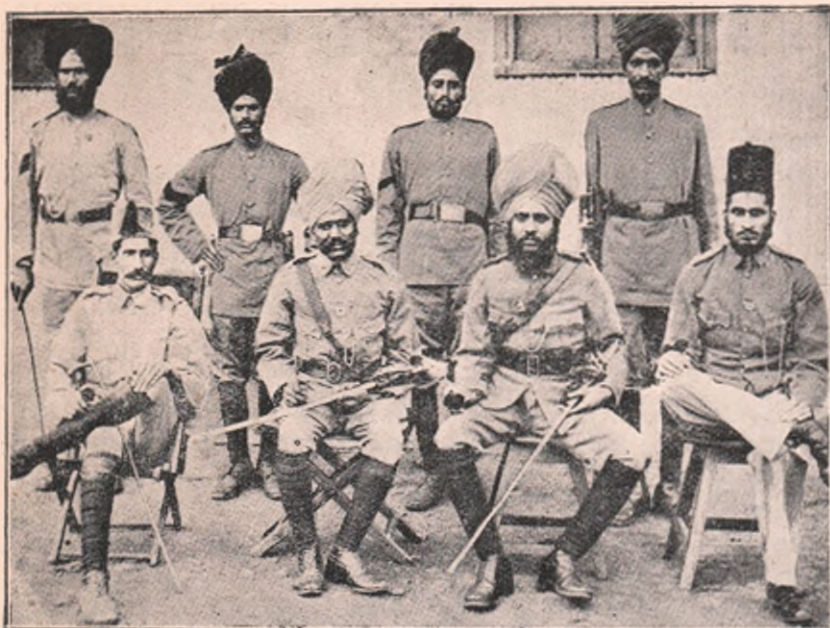
Ofițeri, subofițeri și soldați de rând indieni, aduși pe câmpul de războiu francez, contra Germanilor.