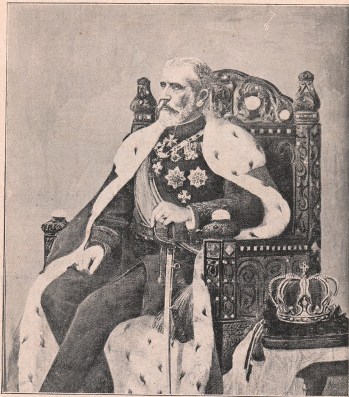
Regele Carol în mantia regală, șezând în Tronul seu...

Oct. — în București, eră enormă. Se socotește la peste 100 mii persoane!