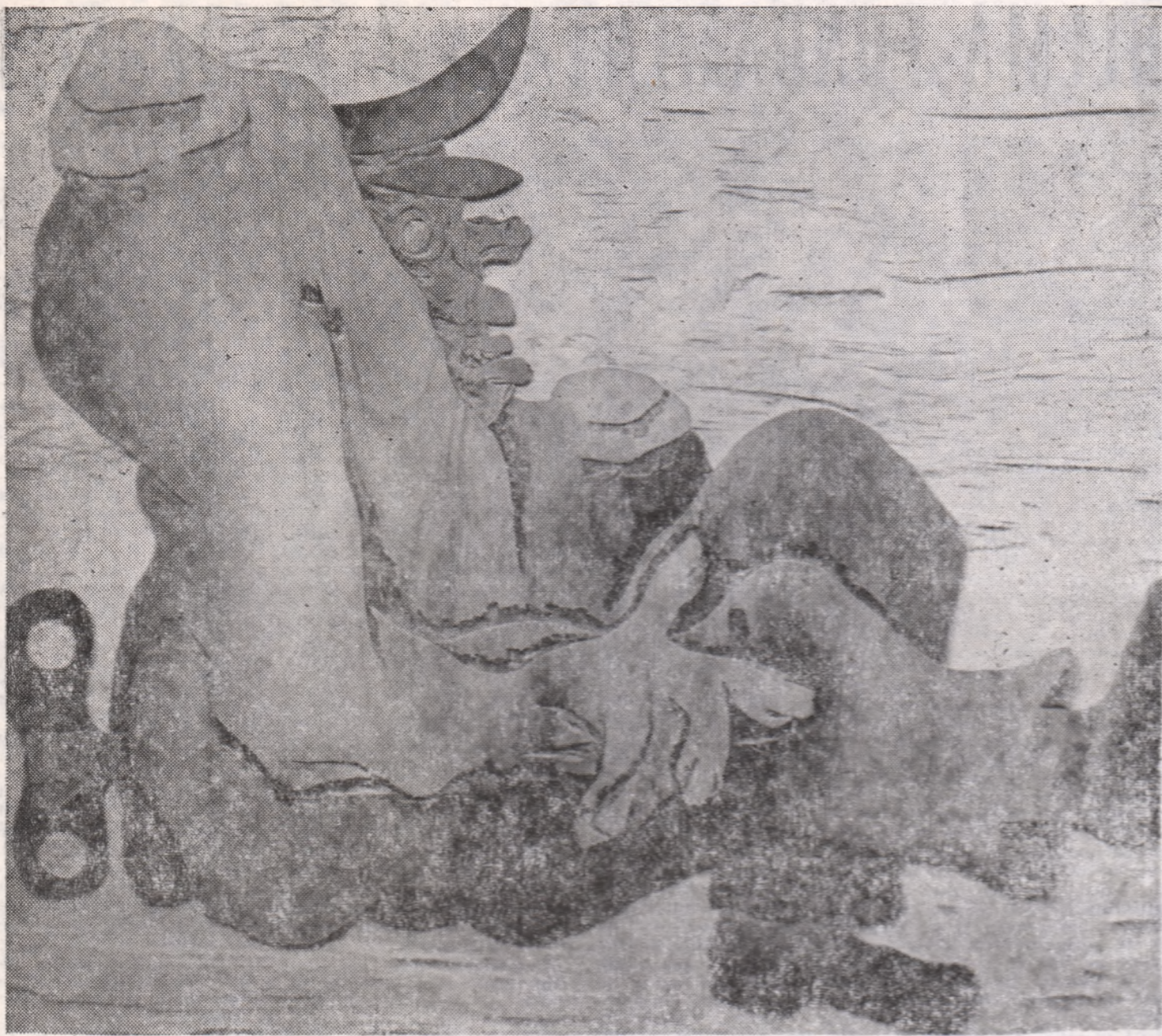
Carlos Colombino (Paraguay)