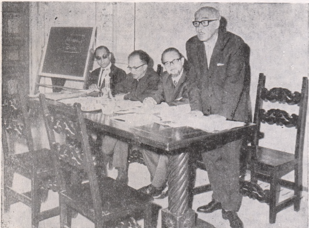
Prof. Anton Dumitriu vorbind la Urbino (Italia) după primirea titlului de „Professore Onorario” la Istituto Superiore di Scienze Umane.

V. PAVELCU: Considerăm că Istoria logicii constituie o carte de căpătîi nu numai pentru specialiștii logicieni și amatori de logică, dar și pentru oricine de logică care este îndrăgostit de rațiune și de valorile ei eterne.