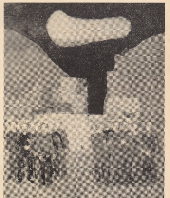
Corneliu IONESCU :