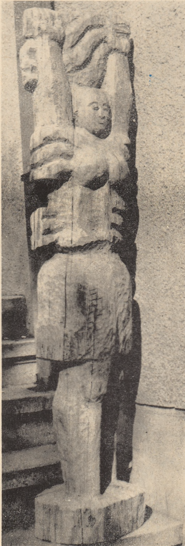
Ion BUZDUGAN :