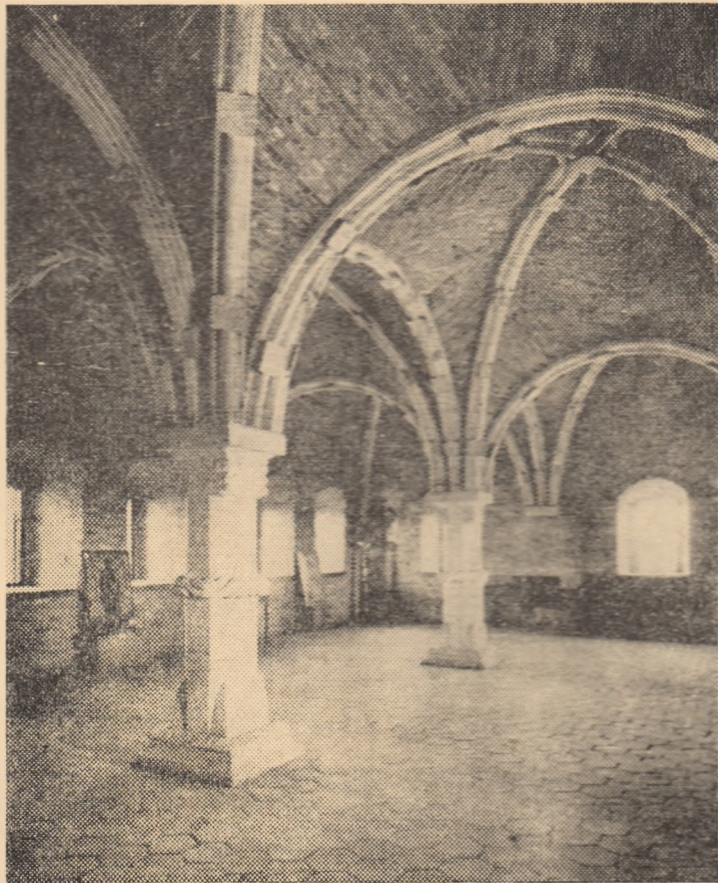
Sala gotică de la Cetățuia