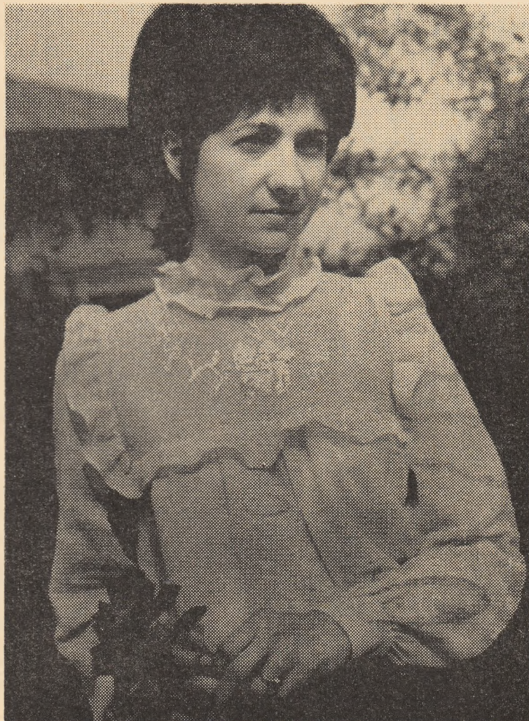
Bluză din bumbac cu broderie „filtre” manuală.