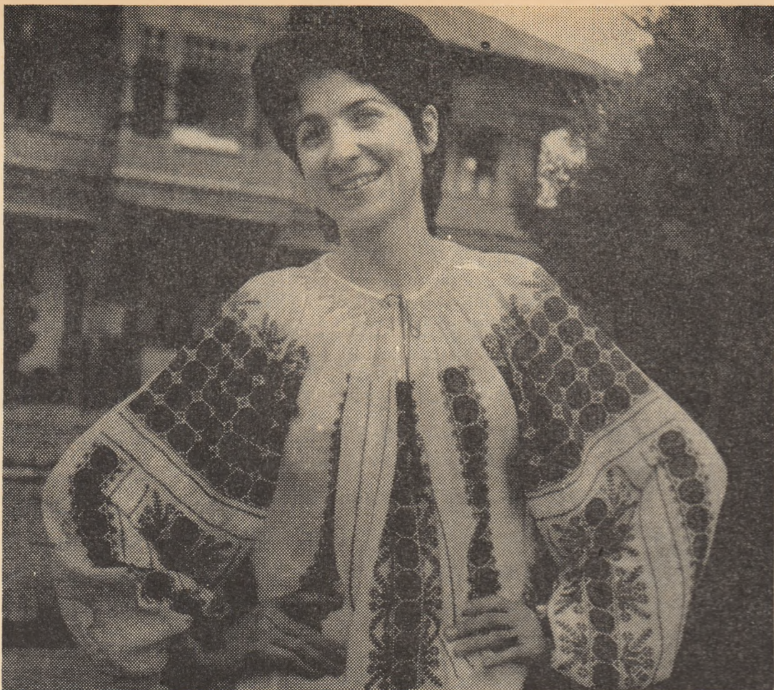
Te din bumbac, model „Breaza” ornamentată cu broderii și cusături.