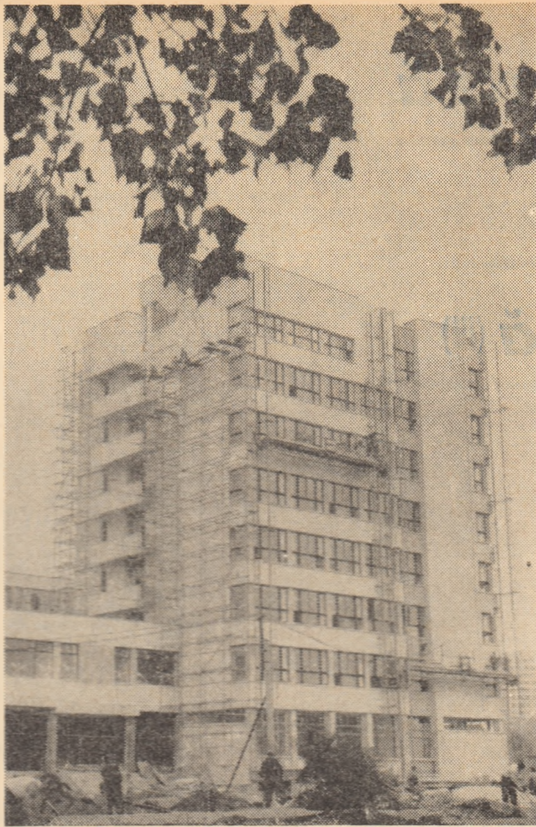
Facultatea de chimie a Institutului politehnic Iași, aproape de conturul final

Desigur că toate mutațiile survenite în concepții și procedee au solicitat profesii noi în construcții, calificări superioare, ridicarea nivelului profesional. Constructorul de azi nu mai e un muncitor ocazional, ci un adevărat specialist care știe precis ce sarcini îi stau în față și realizează construcții la nivelul exigenței mondiale. Constructorul modern construiește azi pe tot întinsul globului, impunînd măiestria sa de bun meșteșugar pe țărîmul Balticeii sau în preajma Vienei. Constructorul român edifică la el acasă blocuri și instituții ce vor concura, trebuie să concureze, cu cele ale oricărui oraș din lume.