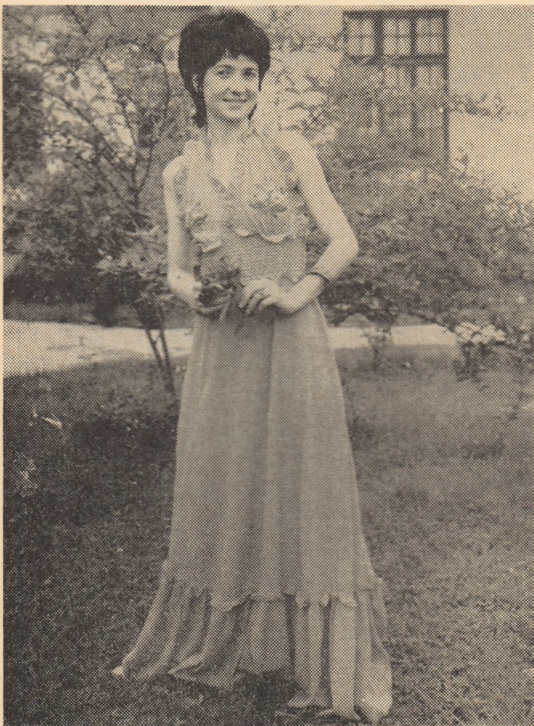
Rochie executată din bumbac 100% și broderii manuale aplicate și integrate.