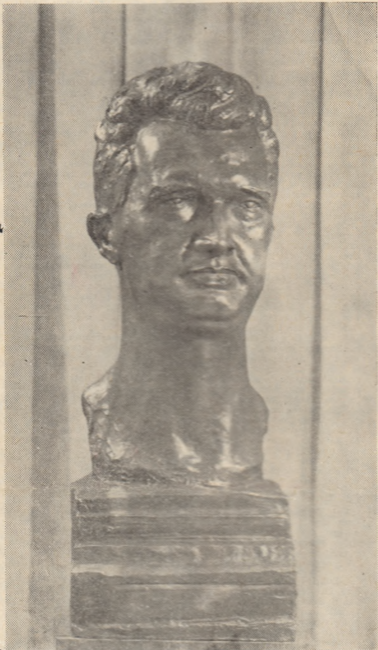
Sculptură de Ion JALEA