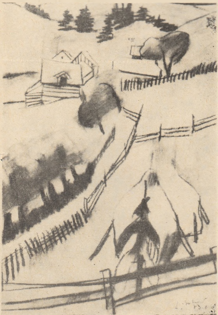
„Uliță la Iacobeni“